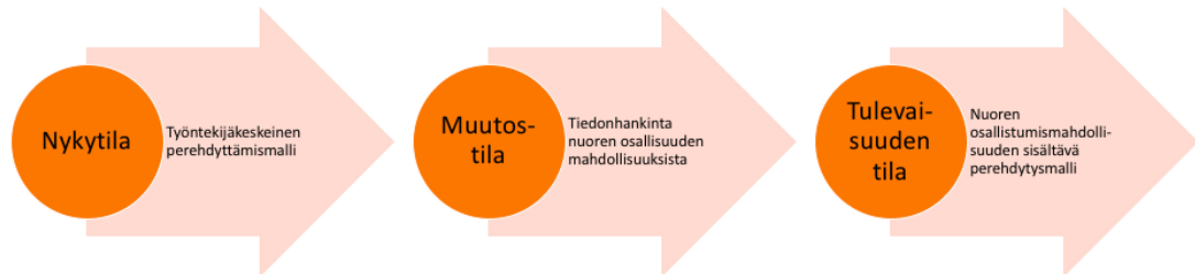
Kuvio 3 Kehittämisprosessi

Jotta nuorisokoti Plaani voi ottaa nuoren mukaan osaksi uuden työntekijän perehdytysprosessia, oli selvitettävä niitä nuorisokodin arjen osa-alueita joihin nuorella voisi olla halu ja mahdollisuus osallistua ja tulla sitä kautta osalliseksi. Koko prosessin ajatusmallia on havainnollistettu alla olevassa kuviossa 3.