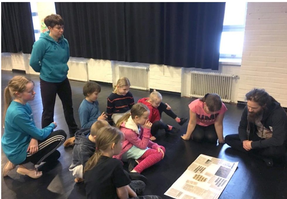
Kuva 3. Keskustelu. Kuvaaja: Anja Saksola 2019.