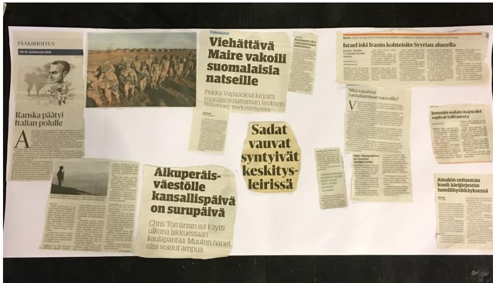
Kuva 2. Uutisia sodasta. Kuvaaja: Anja Saksola 2019.

Työpajan aluksi lapset liimasivat uutiset yhteiselle paperille (Kuva 2.). Alkulämmittelyn jälkeen lapset kertoivat, mistä heidän valitsemassaan uutisessa oli kyse ja miksi he olivat valinneet sen. Keskustelimme myös muun muassa siitä, milloin sotia on ollut Suomessa, missä sotia on nyt sekä miltä tuntuisi asua maassa, jossa soditaan. Puhuimme tunteista, joita uutiset herättivät ja millaiselta tuntuisi itse olla uutisten kertomassa tilanteessa (Kuva 3.). Lapset nostivat esiin pelon ja epätoivon.