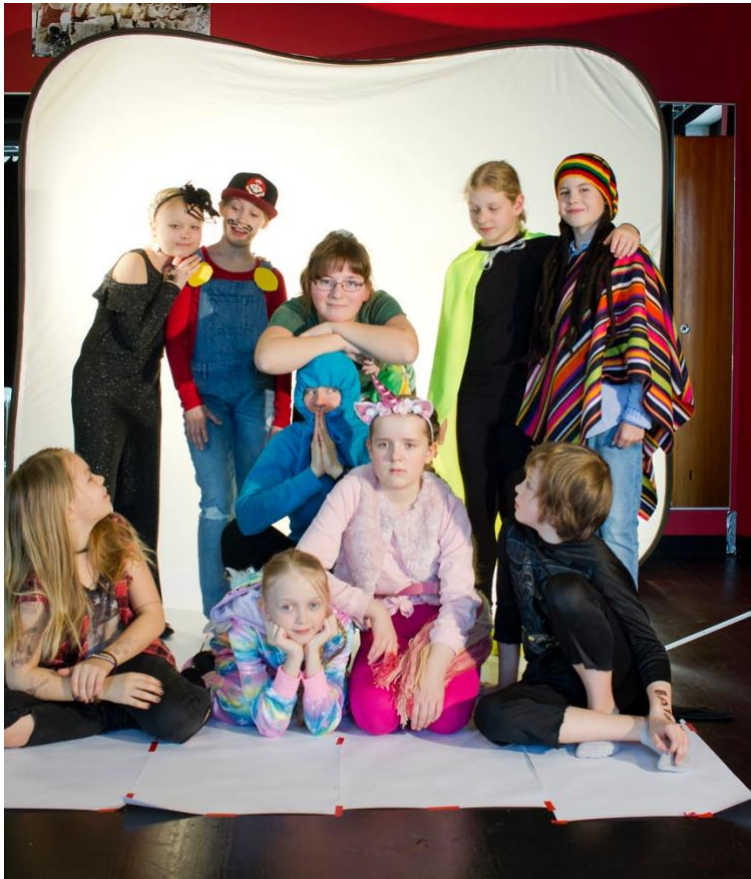
Kuva 4. Supersankarit valmiina ryhmäkuvaan. Kuvaaja: Toni Essel 2019.

tanila, ristilaukka sekä Fortnite-pelin nyrkki ja potku -liike sekä Macarena. Lapsilla oli kotitehtävänä kehittää itselleen supersankariasut, jotka kuvattiin loppukohtausta varten (Kuva 4.). Jokaisella supersankarilla oli omat tanssiliikkeet, jotka he pelianimaatiossa esittivät. Samat supersankarit esiintyivät myös yhdessä pinkkien yksisarvisten kanssa.