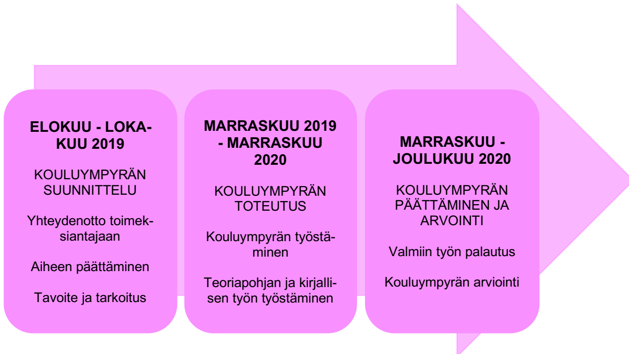
Kuvio 1. Kouluympyrän prosessikaavio

Tämä opinnäytetyö etenee Salosen (2013, 15) lineaarisen mallin mukaan, jossa työskentely etenee tavoitteen määrittelystä suunnitteluun, toteutukseen ja prosessin päättämiseen. Lineaariseen malliin kuuluu lopuksi aina myös arviointi. . Prosessikaavio (kuvio 1) selkeyttää tämän opinnäytetyön etenemistä.