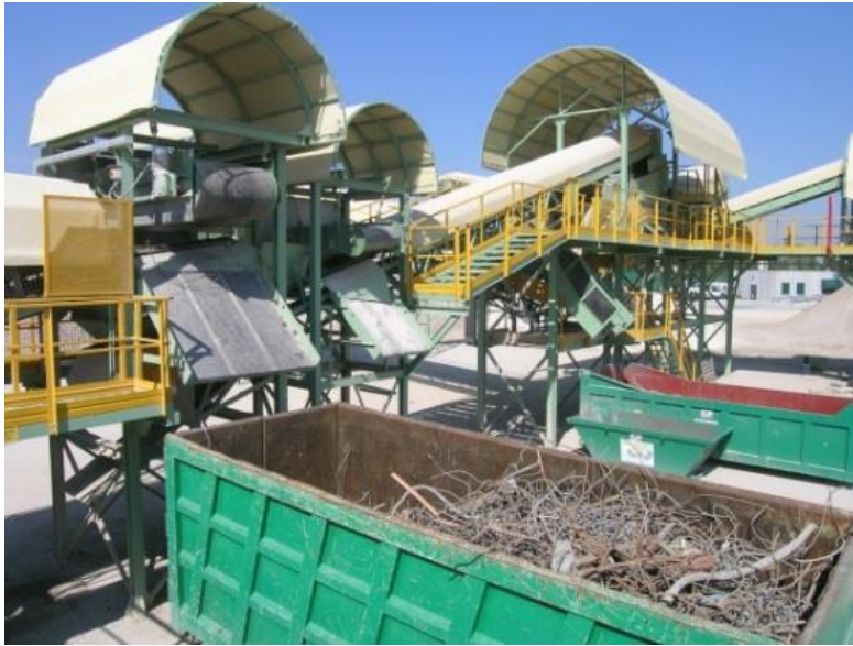
Kuva 8. Rakennusjätteen sekä purkujätteen kierrätyslaitos. (Euroopan komissio 2016, 27)