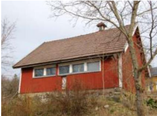
Kuva 2. Vanha rakennus, jota pitää purkaa. (Hanko s.a., 3-4)

Rakennuksen päästessä elinkaarensa päätepisteeseen tulee rakennus hajottaa uuden tieltä. Purettavasta rakennuksesta pitää tehdä joko purkuilmoitus tai hakea purkulupa 30 vuorokautta ennen purkutyön alkamista. Viranomainen selvittää, onko purkamiselle kieltoja tai tarvitaanko lisäselvityksiä, jotta voidaan myöntää purkamislupaa.