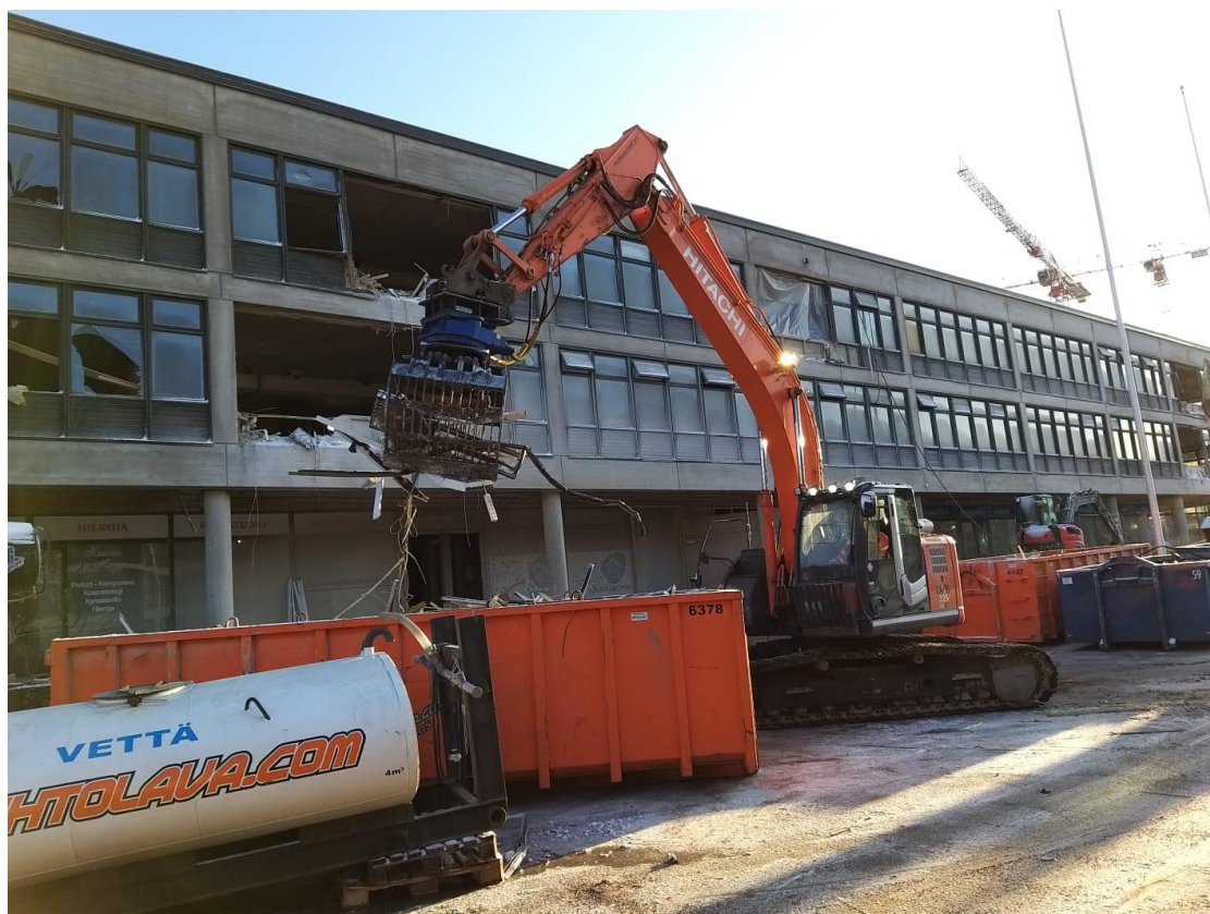
Kuva 12. Kuva on rakennustyömaalta, jossa puretaan rakennusta.

Rakennuksen purkauksen yhteydessä koko talo puretaan tai osa rakennuksen osasta puretaan. Purku voidaan suorittaa niin, että pelkästään ikkunat, seinät ja kaapit puretaan, mutta säilytetään kantavat rakenteet kuten laatat palkit ja pilarit. Koko rakennus on mahdollista purkaa massiivisella purkamisella, jolloin koko rakennus sisältäen rakennuksen rungon ja kantavat rakenteet puretaan myös.