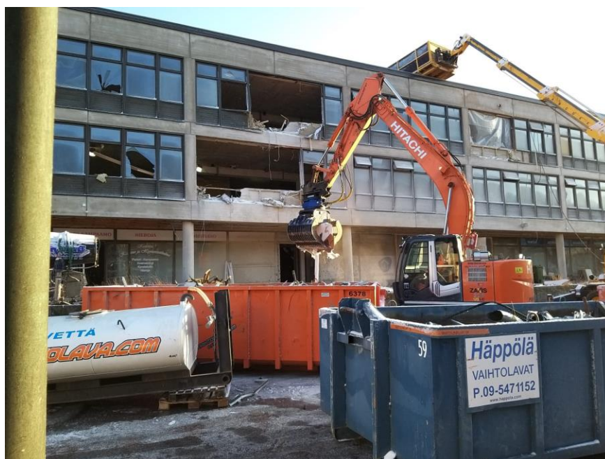
Kuva 10. Rakennuksen purku kaivinkoneilla rakennuksen ulkopuolelta. Rakennusjätteen lajittelu työmaalla eri säiliöissä kuvan mukaisesti.

Keskeinen asia asianmukaisessa jätteen tarkastelussa ja kierrätyksessä on materiaalien pitäminen erillään toisistaan. Mitä paremmin pysyvä rakennus- ja purkujäte lajitellaan, sitä tehokkaampaa kierrätyksestä tulee ja sitä laadukkaampia kierrätettyjä kiviaineksia ja materiaaleja saadaan aikaiseksi. Lajittelun taso on kuitenkin hyvin riippuvainen työmaalla käytettävissä olevista vaihtoehdoista (kuten tilasta ja työvoimasta) sekä lajitelluista materiaaleista tulevista kustannuksista ja siitä, kuinka paljon saadaan tuloa. Lajittelu voi olla erityisen haastava välillä, kun nykyään rakennuksista on tullut yhä monimutkaisempia, mikä vaikuttaa purkutyöhön. Lisäksi muutaman viime vuosikymmenen aikana yhä suurempi osa materiaaleista on liimattu ja myös komposiittimateriaalien käyttö on kasvanut.