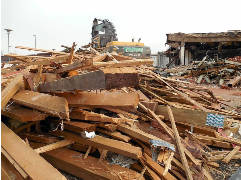
Kuva 3. Kuvassa näkyy, kuinka puut on lajiteltu rakennuksen purkamisen yhteydessä.

On erittäin tärkeää, että purkutyöt suoritetaan suunnitelman mukaisesti. Purkamisen jälkeen urakoitsijan pitää laatia katsaus siitä, mitä tosiasiasa on kerätty syntypaikalla ja minne jättemateriaalit on viety (esimerkiksi uudelleenkäyttöön, esikäsitteilyyn (lajitteluun), kierrätykseen, poltettavaksi tai mahdollisesti kaatopaikalle). Tiedot olisi ensin katsottava vertaamalla niitä inventoinnin mukaisiin arvioihin ja sen jälkeen toimitettava viranomaisille.