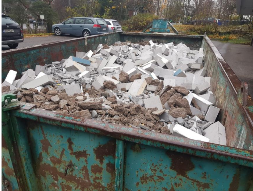
Kuva 9. Rakennusjätteen lajittelu työmaalla. Kuvan tapauksessa betonirakenteet on lajiteltu erillisessä säiliössä muista rakennusjätteistä.

Rakennus- ja purkujätteen kierrätyksessä aloitetaan yleensä helpoimmista materiaaleista, joilla jo on kierrätettyjen materiaalien markkinat. Joissain maissa voidaan aloittaa myös metalleista tai vastaavasti puusta. Jokainen tilanne ja purettava kohde on kuitenkin aina jonkin verran erilainen. (Euroopan komissio 2016, 10-11.)