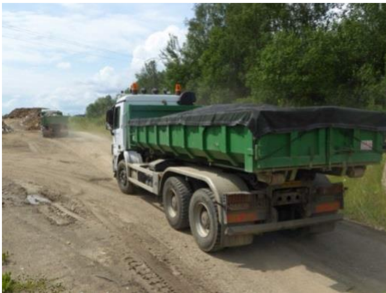
Kuva 7. Kuorma- auto, jolla kuljetetaan rakennus- ja purkujätettä. (Euroopan komissio 2016, 14)

Rakennus- ja purkujätettä kuljetettaessa on syytä yrittää pitää etäisyydet rakennustyömaan ja kuljetettavan määränpään välille lyhyinä. Lajittelu- ja kierrätyslaitosten läheisyys on todella tärkeää rakennus- ja purkujätteellä, koska rakentamiseen käytettävien kiviainesten kaltaista raskasta materiaalia (esim. asfalttia ja betonia) ei pystytä kuljettamaan maanteitse pitkien matkojen päähän (yleensä maksimissaan 35 km). Jos materiaalia ei kuljeteta suurina määrinä rauta- tai vesiteitse, pitkät kuljetusmatkat eivät yksinkertaisesti ole taloudellisesti houkuttelevia ja sen lisäksi kierrätyksen ympäristöhyödyt vähenevät pitkillä kuljetusmatkoilla. (Euroopan komissio 2016.)