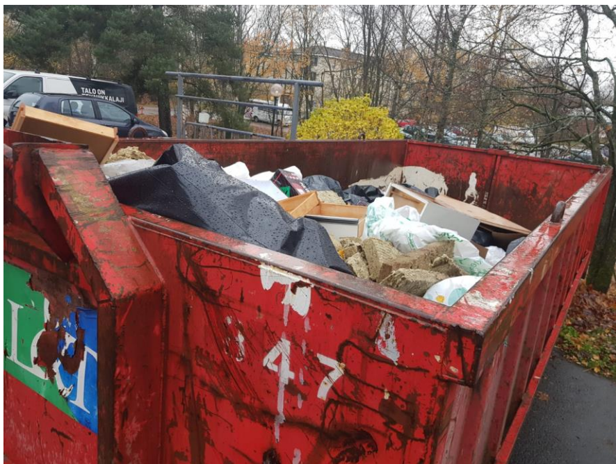
Kuva 11. Rakennusjätteen lajittelu työmaalla. Kuvan tapauksessa eristeet ja kaapit on lajiteltu erillisessä säiliössä muista rakennusjätteistä.