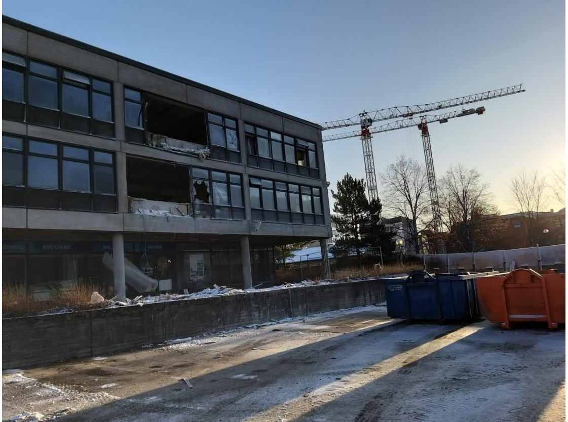
Kuva 13. Kuva on rakennustyömaalta, jossa osa rakennusta on purettu.

purkamiseen ja lajitteluun liittyen, on se, että kotimaisia koneita voidaan tehdä enemmän Suomessa.