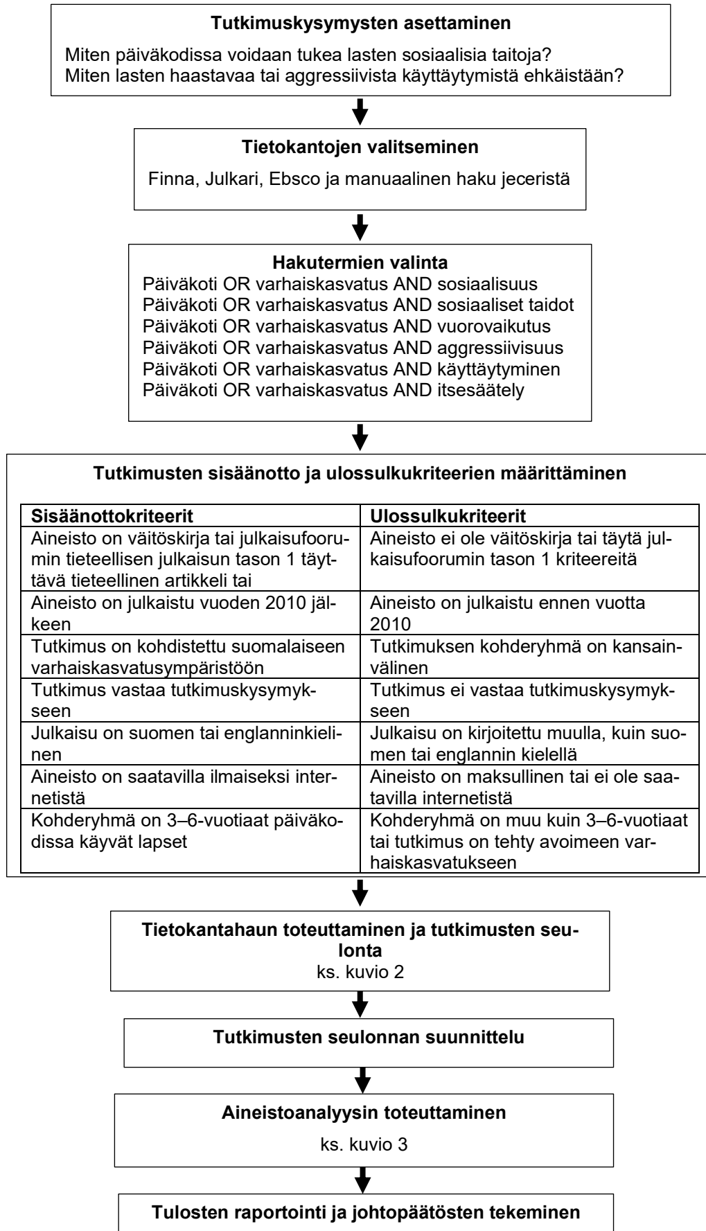
Kuvio 1. Kirjallisuuskatsauksen etenemisen kuvaus.