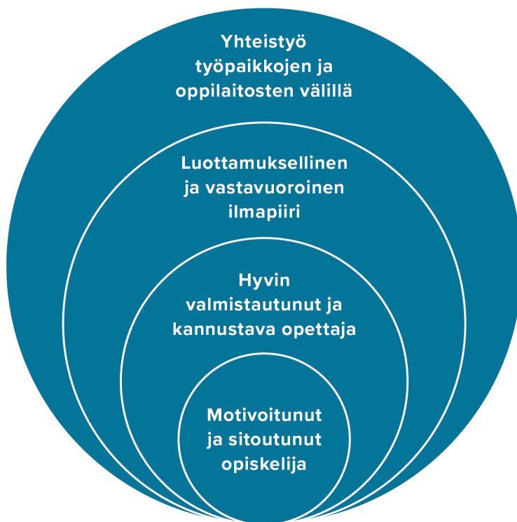
Kuvio 1. Avaimia onnistuneeseen uraohjaukseen (Samppala, M-L).

Työpajoissa ja välitehtävien aikana opettajilta kysyttiin heidän kokemuksiaan onnistuneesta uraohjauksesta. Opettajien kertomuksista muodostui neljä ulottuvuutta, jotka liittyivät työpajan ja oppilaitoksen väliseen yhteistyöhön, ohjausilmapiiriin sekä opettajien että opiskelijoiden rooliin uraohjaus-tilanteissa. Nämä ulottuvuudet on visualisoitu kuviossa 1.