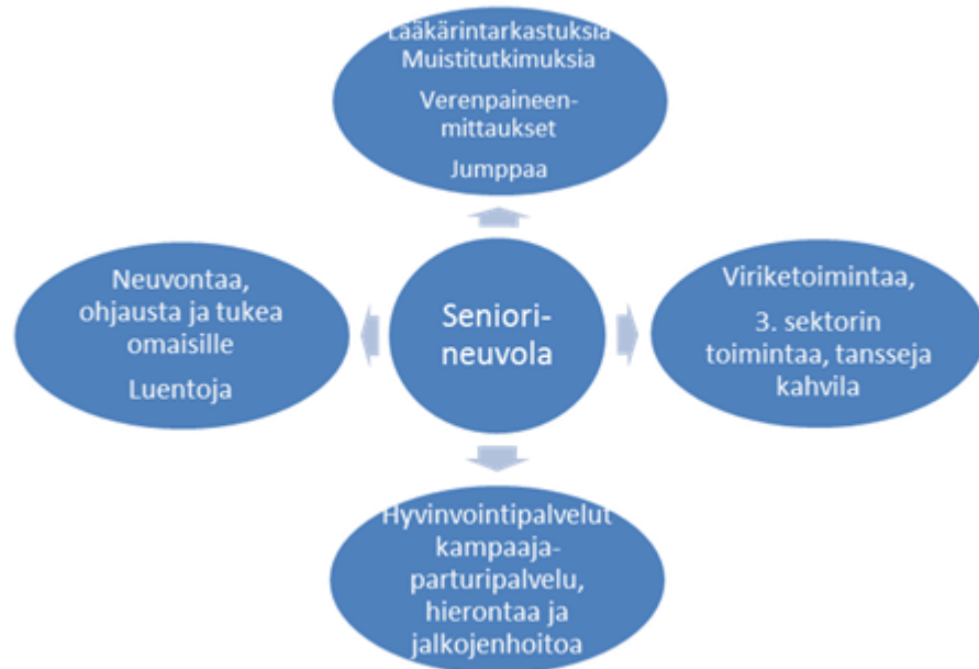
Kuvio 3. Ikäihmisten mielipiteitä seniorineuvola -toiminnasta.

Tässä kuviossa on kuvattu ikäihmisten mielipiteitä palveluista joita he toivoisivat seniorineuvolaan.