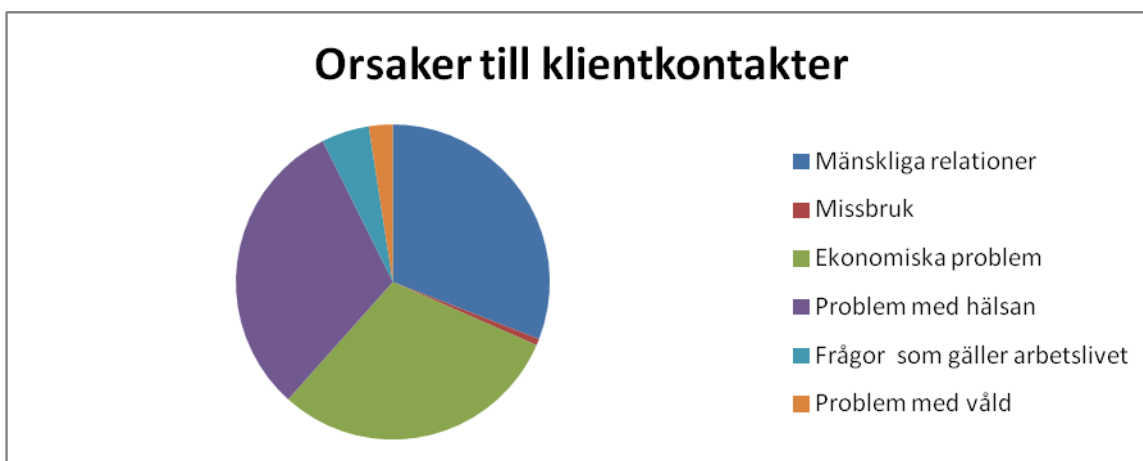
Tabell 1. Orsaker till klientkontakt.

Denna statistik visar att mänskliga relationer, missbruk och ekonomiska problem var de största orsakerna bakom kontakten med diakonimottagningen.