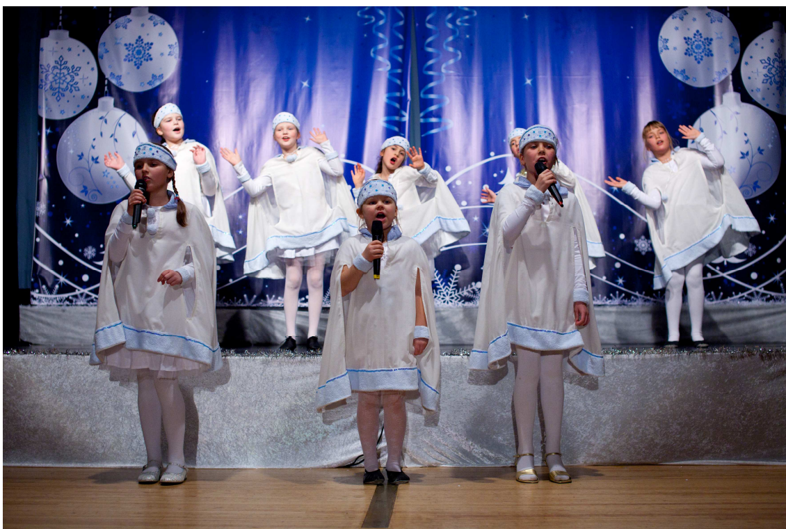
Musikanttien joulujuhla 2010, Projektiryhmän esiintyminen (tytöt 7-12v.)