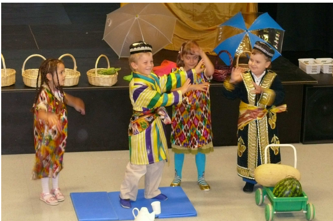
Syysjuhla 2007, Kontulan nuorisotalo