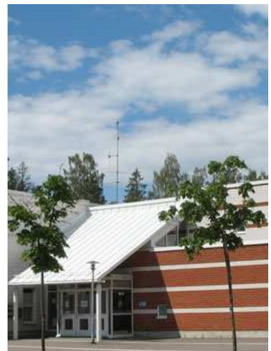
Kuvio 2. Kurkimäen korttelitalo Karpalokuja 7 Helsinki

Kesäkuussa 2008 pääsimme muuttamaan uusiin tiloihin Kurkimäen korttelitalolle, jossa on yli 630m 2 tilaa ja sisältää mm. noin 200 paikkaisen salin pienellä näyttämöllä. Uuden toimitalon tilat mahdollisti monipuolisemman toiminnan ja siitä syystä päädyttiin muuttamaan nimi Lastenkulttuurikeskus Musikantiksi. Lastenkulttuurikeskus nimenä edustaa sitä kohderyhmää jota toiminnalla tavoitellaan, eli ala-asteikäisiä ja sitä nuorempia lapsia ja heidän perheitään.