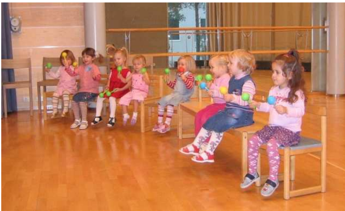
Muskaritunti Kivikon nuorisotalolla 2005