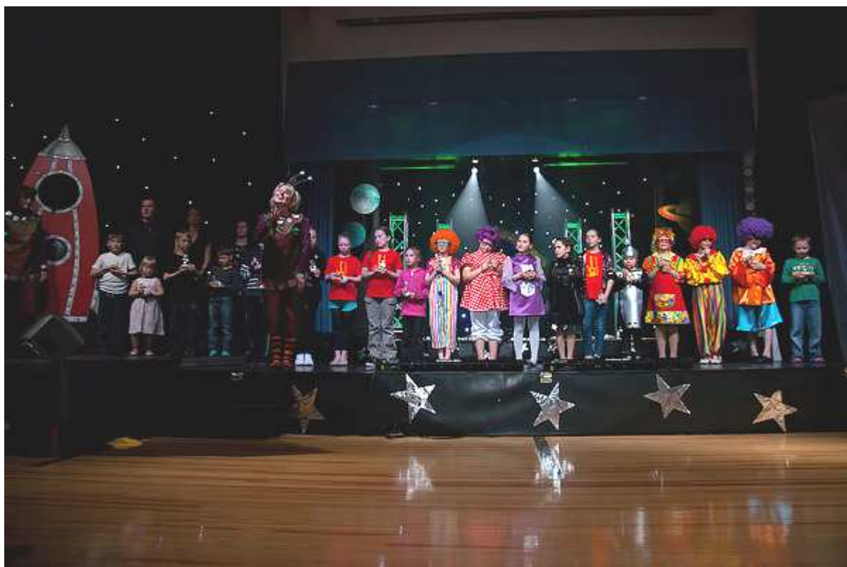
Lavalla koko tiimi tekijöitä