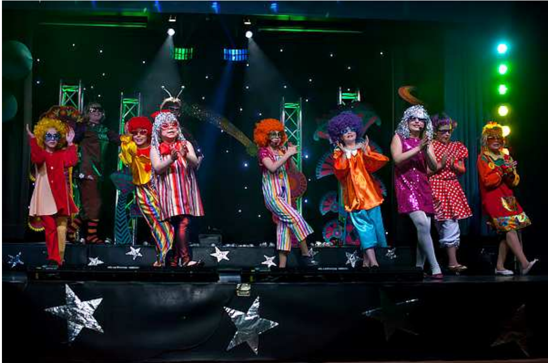
Kuvio 5. Musikanttien kevätjuhla 2011. Teemana avaruus. Lavalla projektiryhmän lapset.

juhlasalimme. Konserteissa lapsille esiintyvät myös omat opettajamme. Musiikkileikkikoulun juhla on yleensä jännä tarina näytelmä, joka johdattelee juhlaa ja vie lapset mukaansa. Opettajiamme voi nähdä erilaisissa rooleissa kuten poro tai avaruusseikkailijat. Oman opettajan esiintyminen on hyvä esimerkki lapsille. Juhlan jälkeen vanhemmat kertovat, että olivat itsekkin tarinassa mukana.