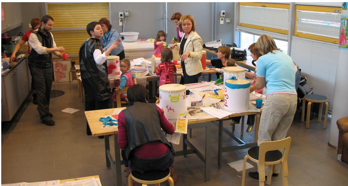
Musikanttien rumpukurssi perheille 2006, Kivikon nuorisotalolla.