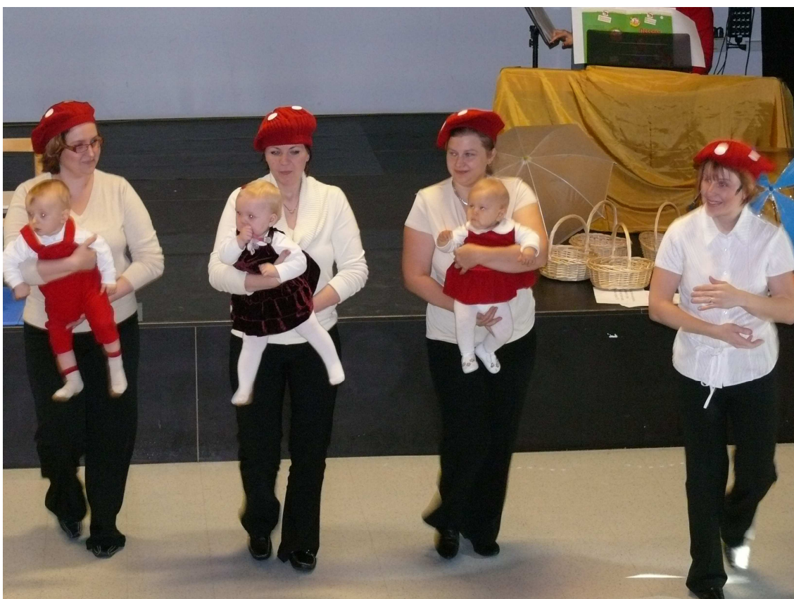
Syysjuhla 2007, Kontulan nuorisotalo