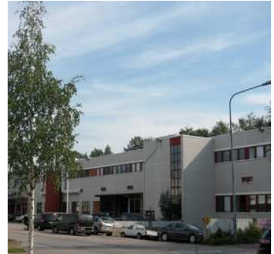
Kuvio 1. Sirrikuja 1 Helsinki

Kulujen karsimiseksi aloitimme uusien tilojen etsimisen. Samoihin aikoihin Mellunkylän alueella toimivat aktiivit