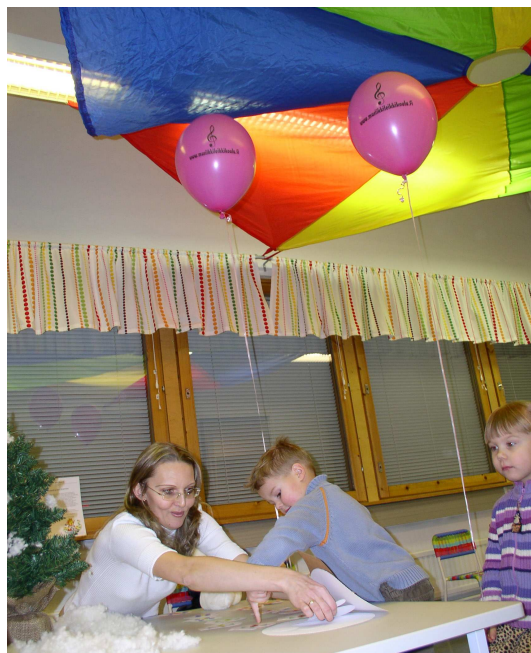
Musiikkileikkikoulu Musikantit, Ensimmäiset omat tilat tammikuussa 2007