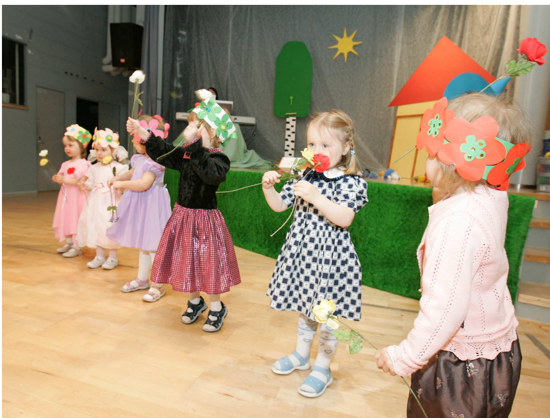
Musikanttien kevätjuhla 2006, Kivikon nuorisotalolla.