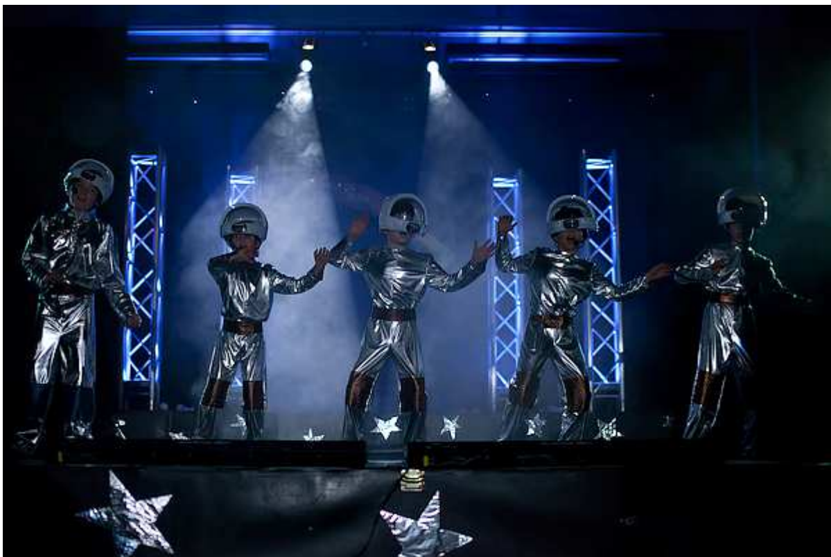
Kevätjuhla 2011 avaruusteemalla. Lavalla laulavat "kosmonautit" (pojat 7-10v.)