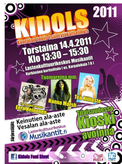
Kuvio 3. Kidols mainos vuodelta 2011

"Vetoa ja Voimaa Mellunkylään on alueen asukas- ja yrittäjäjärjestöjen, alueella asuvien