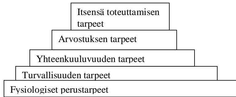
KUVIO 1 Maslow'n tarvehierarkia (Rytikangas, 2011)

Turvallisuus on inhimillinen peruspyrkimys, joka on tunnistettu psykologian monissa suuntauksissa. Se on keskeinen inhimillinen ja sosiaalinen arvo. Arvona turvallisuus merkitsee myös luotettavuutta eli ennustettavuutta ja levollisuutta. (Niemelä & Lahikainen 2000,22.) Turvallisuuden tunteen kannalta lauman ominaisuudet, kuten läheisten ihmisten läsnäolo ja huolenpito ovat tärkeitä. Vain yhteiskunnan jäsenet voivat luoda toisilleen tunteen turvallisesta yhteiselämästä. (Ollila 2008,123.)