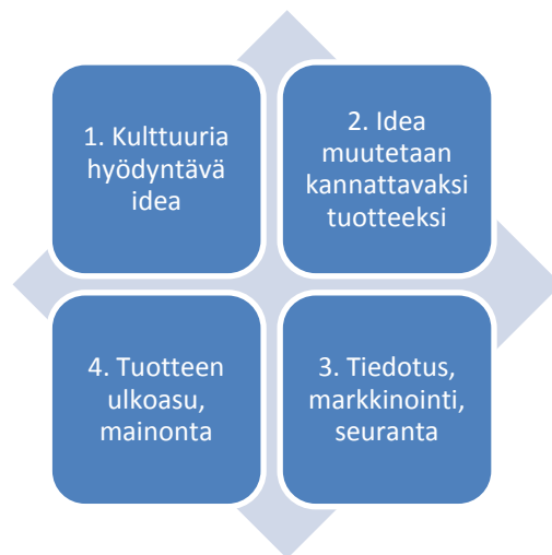
Kuva 2. Tuotteistamisen ulottuvuuksia

Kulttuurin tuotannon näkökulma edellyttää tuotteistamisen perusidean ymmärtämistä (kuva 2). Markku Wilenius näkee juuri tämän tuotteistamisen perusidean ja verkostomaisen prosessin kokonaisvaltaisen ymmärtämisen olevan uusi asia sekä kulttuurisektorin että myös talouselämän toimijoille. (Wilenius 2004, 120.)