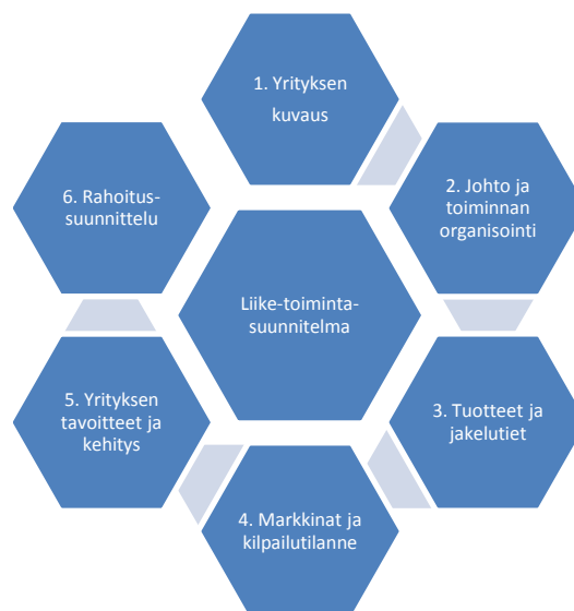
Kuva 1. Esimerkki liiketoimintasuunnitelmasta

Varsinaisessa arviointivaiheessa ideaa arvioidaan tarkemmin kaupallistumisen näkökulmasta. Tavoitteena on hahmottaa ja kehittää hankkeen kaupallistamispolkua sekä avata uusia näkymiä menestyvän idean tuotteistamiseen. Arviointivaiheessa hankitaan palveluja ja kumppanuuksia, jotka edistävät hankeidean kaupallisen potentiaalin kasvua ja poistavat esteitä menestymisen tieltä. Tällaisia voivat olla esim. erilaiset yhteistyökumppaneiden kartoitukset, laaja-alaisemmat markkina-analyysit, liiketoiminta- ja rahoitussuunnitelmat sekä teknologiatason ja kilpailuetujen arvioinnit.