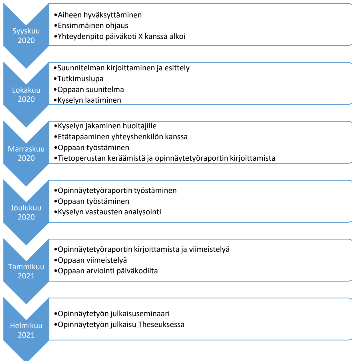
Kuvio 1. Opinnäytetyöprosessin kuvaus

opinnäytetyöraporttimme kohta kohdalta läpi. Tämän ohjaustuokion pohjalta teimme muutoksia raporttiin. Tammikuun aikana opinnäytetyöraporttia sekä opasta viimeisteltiin. Opas lähetettiin sähköpostilla päiväkodille X työntekijöiden arvioitavaksi. Työntekijöiden kommentit ja palautteet otettiin huomioon oppaan lopulliseen versioon. Tammikuun lopussa opinnäytetyö palautettiin arvioitavaksi. Helmikuussa opinnäytetyö esitettiin julkaisuseminaarissa ja julkaistiin Theseukseen. Opinnäytetyöprosessimme eteni kuvio 1 mukaisesti.