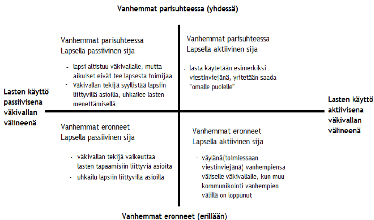
Kuvio 5 : Lapset väkivallan välineenä -nelikenttä

Lopullisessa nelikentässä on vanhempien suhteen määrittelyyn lisätty käsitteet yhdessä ja erillään, sillä esimerkiksi väkivallan uhrin tullessa turvakotiin, ovat vanhemmat erillään, mikä ei kuitenkaan tarkoita välttämättä sitä, että vanhemmat eroaisivat. Koska haastatteluissa nousi esiin se, että turvakotiasiakkuus ei välttämättä tarkoita suhteen päättymistä, koin tarpeelliseksi korostaa nelikentässä sitä, ettei vanhempien erolla välttämättä tarkoiteta lopullista eroa. Haastateltavat toivat puheessaan esiin monia sellaisia esimerkkejä, joita on kuvattu myös tämän opinnäytetyön teoriaosassa ja vallan ja kontrollin pyörässä. Vaikka työssä ei erityisesti noussut esiin uusia tapoja käyttää lapsia väkivallan välineenä, on nelikenttä itsessään uusi tapa kuvata ilmiötä.