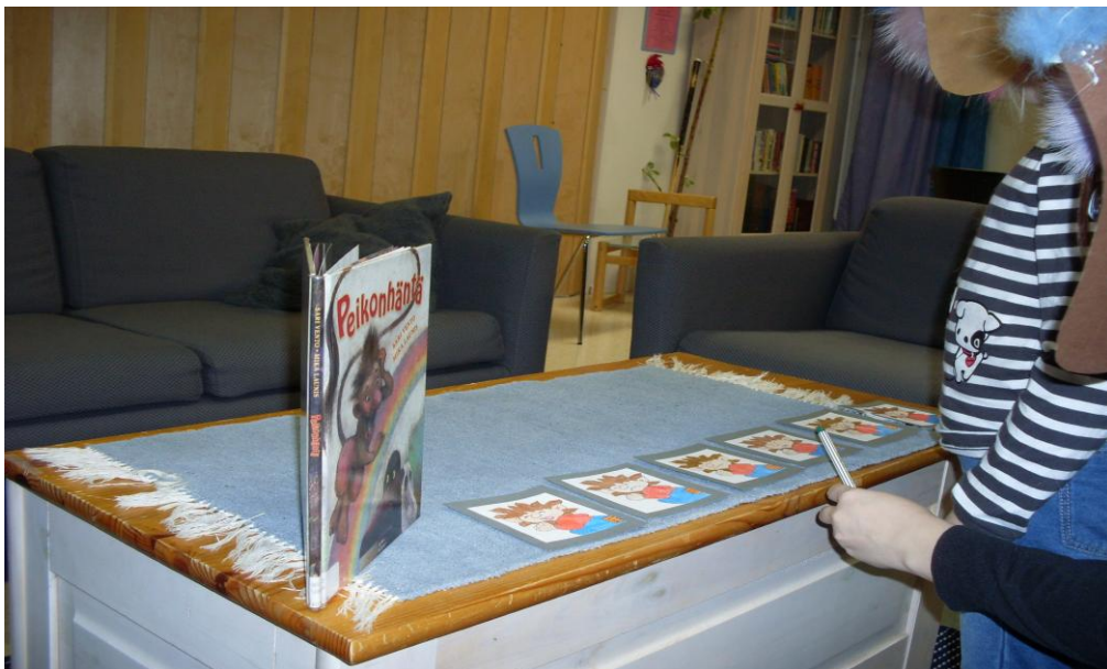
KUVIO 1. Peikkokortit-tunnekortit ja Peikönhätä-kirja

Seitsemän ensimmäistä interventiota noudatti rakenteeltaan samanlaista kaavaa. Ennen jokaista interventiota saavuimme aikaisemmin laittamaan kaikki valmiiksi toiminnallista hetkeä varten. Lapset saapuivat sovittuun aikaan työntekijän kanssa nuorisotalon tiloihin, johon olimme luoneet sohville rennon sadutustilan. Interventiot aloitimme aina lasten tunnetilan kartoituksella käyttämällä apuna tekemiämme peikkokortteja (liite 6), joista jokainen peikko edusti erilaista tunnetilaa. Tunnetiloiksi olimme valinneet innostuneen, iloisen, ujon, väsyneen, surullisen ja ärtyneen (KUVIO 1). Tunnekartoituksen jälkeen siirryimme jokaisen intervention toiminnalliseen osuuteen, jotka avaamme erikseen auki myöhemmin tässä kappaleessa.