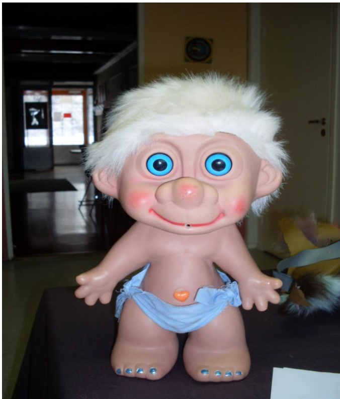
KUVIO 2. Helmi-peikko

Jokaisella interventioikerralla meillä oli mukana peikkohahmo, joka sai lapsilta nimekseen Helmi-peikko (KUVIO 2). Helmi-peikko toimi sadutuskerroilla puheenvuoron jakajana, jolloin puheenvuoron saanut lapsi sai pitää peikkoa sylissä. Peikko toimi myös tukena ja turvana yksilösadutuksessa. Jokainen interventio päättyi tunnetilan kartoitukseen samoilla peikkokorteilla sekä suullisen palautteen keruuseen lapsilta ja mukana olleelta työntekijältä. Muista interventioista rakenteeltaan poikkesi viimeinen interventio, josta kerromme tarkemmin myöhemmin.