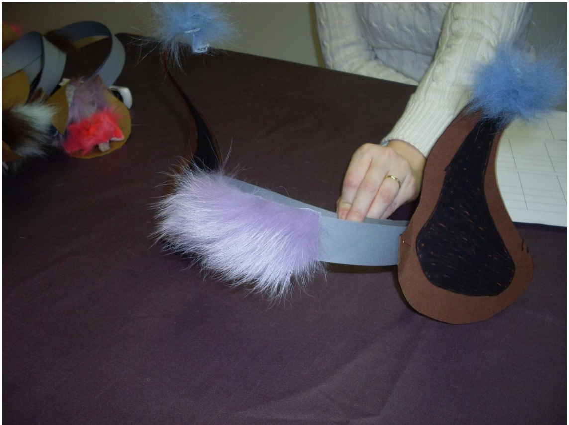
KUVIO 3. Peikko-satulakki

Ensimmäisellä kerralla oli tarkoituksenaamme johdatella lapset sadun maailmaan lukemalla peikko-aiheisen kirjan sekä askartelemalla yhdessä lasten kanssa peikko-satulakki (KUVIO 3), jota lapset tulivat pitämään päässään jokaisella interventiokerralla. Tavoitteena ensimmäisessä interventiossa oli myös tutustuminen, ryhmäytyminen sekä yhteisten ”pelisääntöjen” luonti.