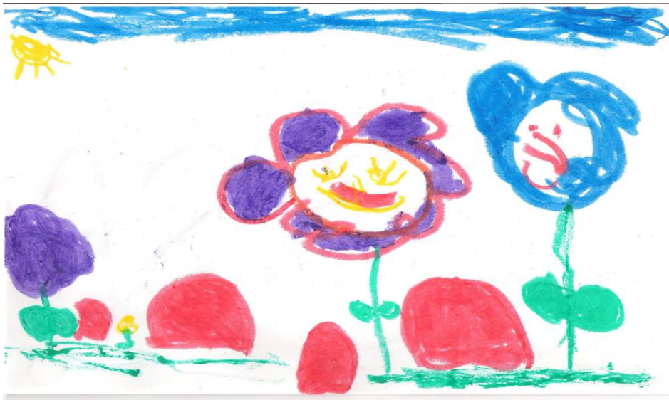
KUVIO 5. Annin piirustus

”Tuli salama ja aurinko meni pilveen. Tuo ei ollut vauva, se muuttu pieneks ku tuli salama. Tuokin oli ihan pieni. Sitten se isi huutaa ku sitä niin nukutti ja se haukotteli kovaa. Sitten se huusi ni äiti hermostu. Sitten ku se äiti lähti hoitaan vauvaa ni se kompastu kiveen. Sitten ku se kompastu kiveen ni se kaatu tohon vauvaan, joka oli joskus iso. Sitten tuokin kompastu ni se meni sitten äitin päälle. Sitten isiki kaatu ton päälle. Sitten tuli salama ja ne meni ihan märäksi ja sitten ne kuoli.”