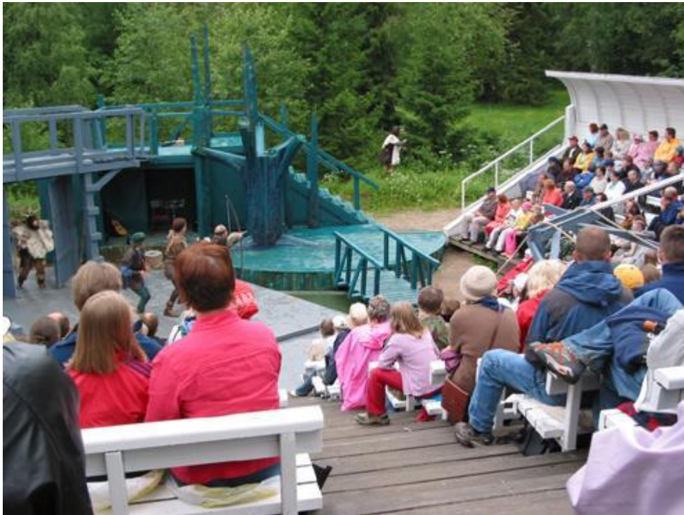
Kuvio 4 Oulun Työväen Näyttämön kesäteatteri.

Haastattelin Oulun Työväen Näyttämön puheenjohtajaa Mari Kurkimäkeä Seinäjoella 14.8.2011.