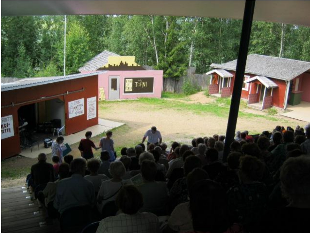
Kuvio 3 Teatteri Kajon kesäteatteri kesällä 2011.