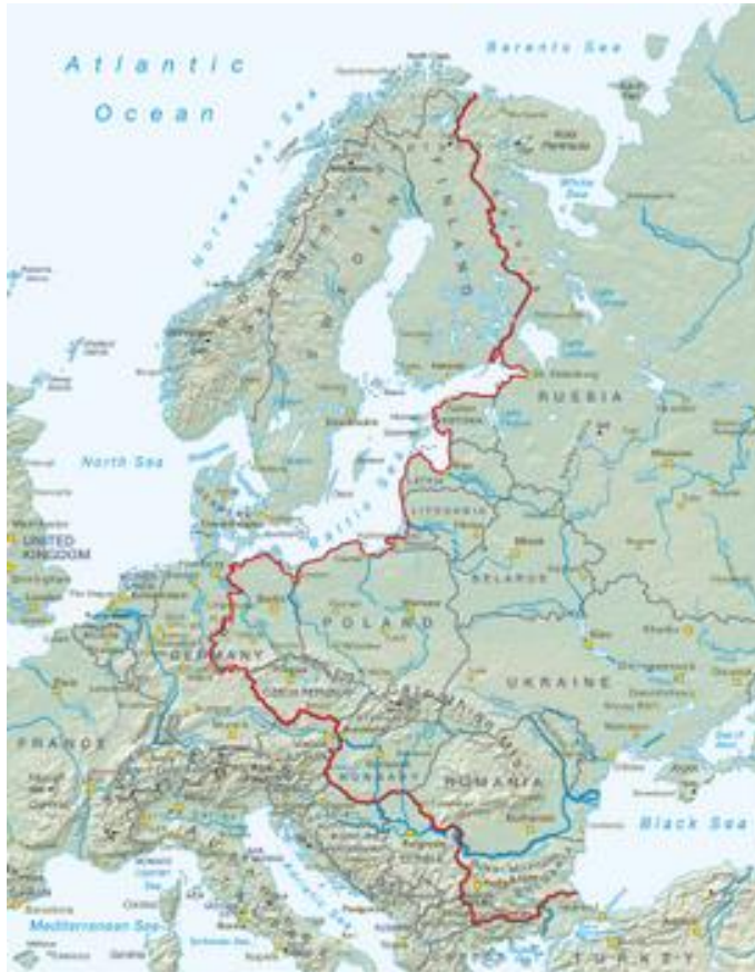
Kuva 1. Iron Curtain Trail

Iron Curtain Trail on kehittynyt toisen maailmansodan jälkeisestä Euroopan kahtiajaosta länteen ja itään. Se koostuu yhteensä 6 800 kilometriä pitkistä pyöräilyreitistöistä. Reitti houkuttelee matkailijoita kokemaan historiallisen Euroopan kahtiajaon. Iron Curtain Trail alkaa Mustaltamereltä ja ulottuu Barentsin merelle saakka (kuva 1.) Saksan osuus on siitä poikkeava, että reitti kulkee Saksan läpi, ei valtion rajoja pitkin. (European parliament 2011.)