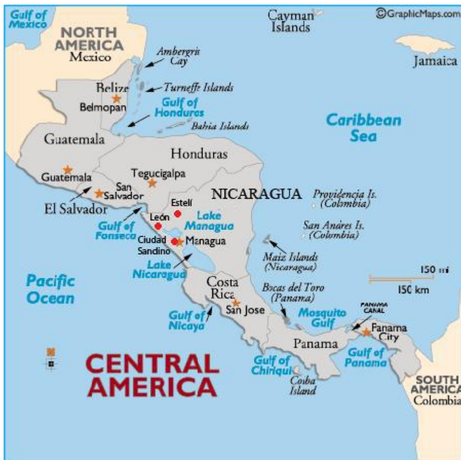
Kuva 1. Nicaragua kartalla (mukailten Suomen suurlähetystö, Managua 2010a).

Nicaragua on Keski-Amerikan suurin ja harvaanasuvin valtio. Perustuslaillises- sa tasavallassa on asukkaita 5,82 miljoonaa ja heistä lähes 2,5 miljoonaa elää köyhyydessä. Bruttokansantuote asukasta kohden oli 2567 Yhdysvaltain dollaria vuonna 2008. Trooppisen ilmastonsa vuoksi nicaragualaisten pääelinkeino on maa- ja metsätalous sekä kalastus. Kahvi- ja tupakkaplantaasit peittävät osaa Nicaraguan tasangoista tulivuorijonojen välissä. (Ulkoministeriön kehitysviestintä 2011.) Keski-Amerikan kannaksella sijaitsevalla Nicaragualla on rantaviiva sekä Tyynenmeren puoleisella, että Karibianmeren puoleisella rannikolla (kuva 1). Ni- caraguan naapurimaita ovat Honduras ja El Salvador pohjoisessa sekä Costa Rica etelässä. (Suomen suurlähetystö, Managua 2010a.)