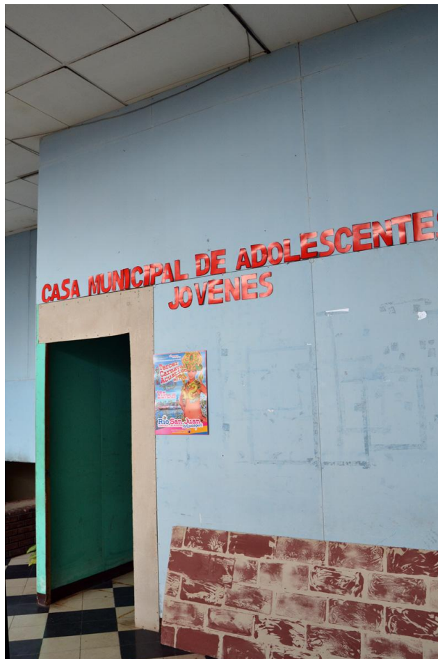
Kuva 4. Leónin pieni nuorisotila.