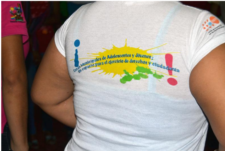
Kuva 5. Voz Joven -projektin kampanjapaita.