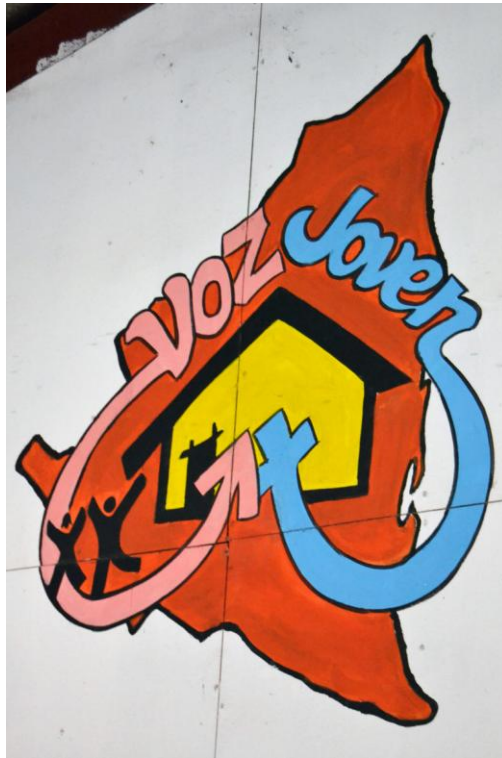
Kuva 1. Voz Joven -projektin logo.