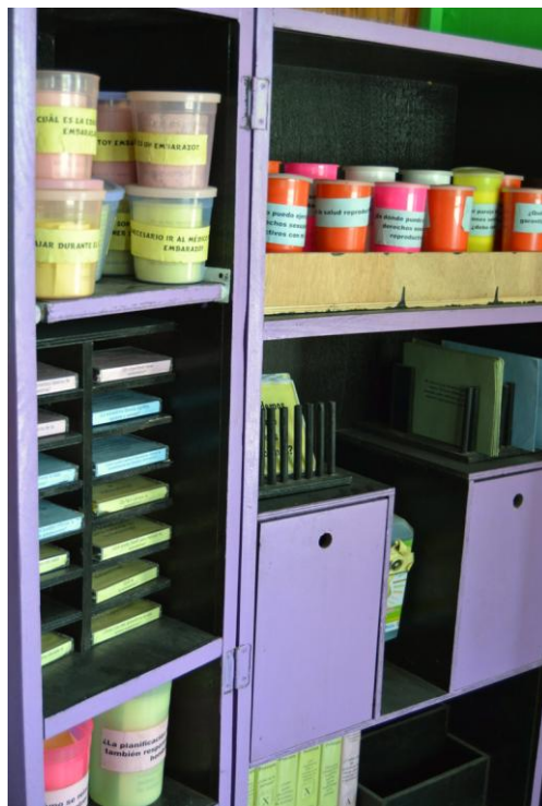
Kuva 2. Baúl Mágico -kaappi, osallistavan seksuaalikasvatuksen väline.