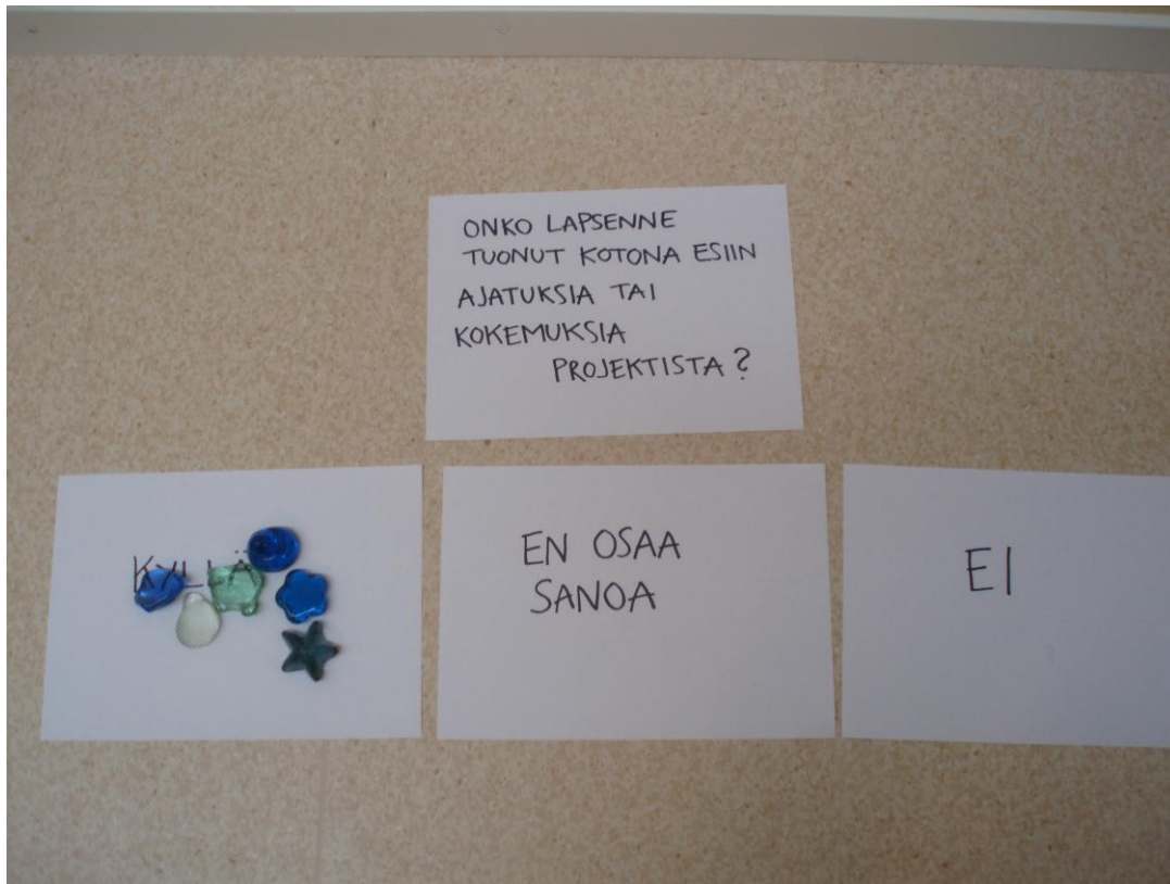
Kuvio 2. Vanhempien mielipiteiden jakautuma.