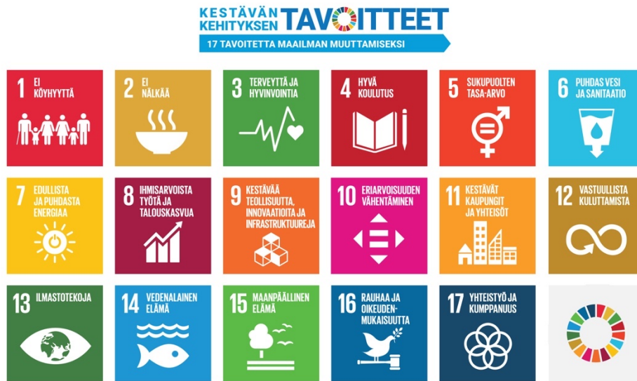
Kuva 1 YK:n kestävän kehityksen tavoitteet. (Suomen YK-liitto, n.d.)

Kestävän kehityksen 12. tavoite pyrkii kestävään tuotantoon sekä kulutukseen. Nykypäivän kulutus ja tuotanto ei ole optimaalisessa tilanteessa, mutta valtiot ovat sopineet ja sitoutuneet veden, maaperän sekä ilman saastumisen ehkäisyyn erilaisten ympäristösopimuksien kautta. Ympäristösopimuksia ovat esimerkiksi Montrealin pöytäkirja, Baselin sopimus, Rotterdamin sopimus, Tukholman sopimus sekä Minamatan sopimus. (Suomen YK-liitto, n.d.d) Suomessa kestävä tuotanto ja kulutus näkyvät vähähiilisen sekä resurssitehokkaan yhteiskunnan saavuttamisen tavoitteena. Suomen ilmasto- ja muut ympäristövaikutukset muodostuvat muun muassa maan sisäisestä kulutuksesta ja investoinnista. Erityisiä haasteita ovat Suomen hiilidioksidipäästöt, jätemäärät sekä luonnonvarojen käyttö. (Ympäristöministeriö, 2010)