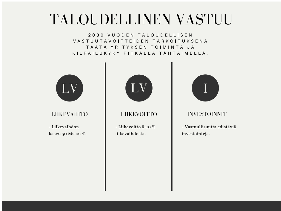
Kuva 4 Taloudellisen vastuun tavoitteet vuoteen 2030 mennessä.

Vastuullisen hankinnan tavoitteet (Kuva 5 s. 36), keskittyvät varmistamaan Kotivaran toimittajien vastuullisuutta ja turvallisuutta. Tulevaisuudessa tarkoituksena on varmistaa, että toimittajat noudattavat YK:n kestävän kehityksen periaatteita ja laativat vastuuhjelman. Uusia kumppanuussopimuksia tehdessä, Kotivara kiinnittää huomiota BSCI-luokitukseen ja auditoi sekä uusia että vanhoja toimittajiaan säännöllisesti. Yritys haluaa panostaa tulevaisuudessa myös käyttämiinsä pakkausmateriaaleihin. Näin ollen tavoitteeksi on asetettu vuoteen 2030 mennessä pakkausmuovin 100 %:n kierrätettävyys.