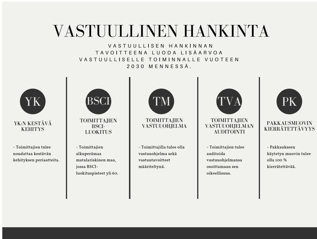
Kuva 5 Vastuullisen hankinnan tavoitteet vuoteen 2030 mennessä.