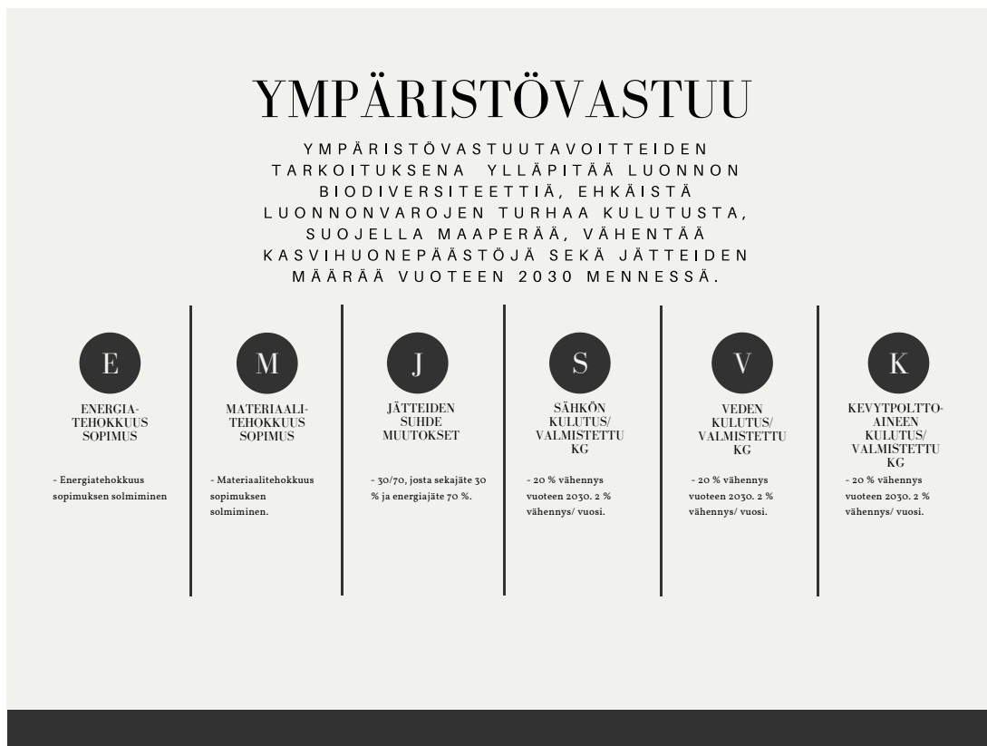
Kuva 2 Ympäristövastuun tavoitteet vuoteen 2030 mennessä.

Sosiaalisen vastuun tavoitteiden tarkoituksena on huomioida ja arvostaa. Kuva 3 (s. 34) sosiaaliset tavoitteet jaettiin työturvallisuuteen sekä vastuulliseen johtamiseen. Tavoitteena on parantaa edelleen työturvallisuutta sekä kehittää työntekijöiden hyvinvointia ja viihtyvyyttä.