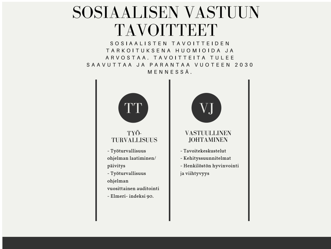
Kuva 3 Sosiaalisen vastuun tavoitteet vuoteen 2030 mennessä.

Taloudellisten vastuutavoitteiden tarkoituksena on taata yrityksen toiminta ja kilpailukyky pitkällä tähtäimellä. Näin ollen ajatuksena on Kotivaran liikevaihdon sekä liikevoiton kasvatus siten, että se kykenee tulevaisuudessa jatkamaan toimintaansa ja harjoittamaan mittavampaa yritysvastuuta. Kotivaran on tarkoituksena tarkastella tulevaisuudessa uusia investointeja siten, että vastuullisuuden ulottuvuudet toimivat entistä ratkaisevimpina tekijöinä investointipäätöksissä. Taloudelliset tavoitteet on koottu Kuva 4 (s. 35).