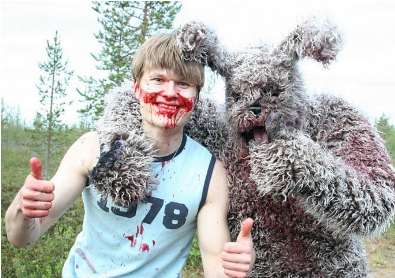
Kuva 3. Bunny The Killer Thingin Tanhuan kuvauksista kesällä 2010.

Bunny the Killer Thingin tekoa muistelen varmasti vielä vanhainkodissakin haikeana lämmöllä, vaikka siitä muodostuikin yksi raskaimmista rooleistani näyttelijänä ja äänisuunnittelijana, mutta se oli myös yksi opettavaisimmista projekteista. Tämän jälkeen voin ylpeänä sanoa, että olen tehnyt aitoa vanhan koulukunnan findietä. Jatko-osaa suunnitellaan jo ja sen budjetiksi arvioidaan 20 000 - 30 000€. Olisiko aika pienelle crowd fundingille?