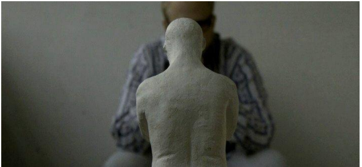
Kuva1. Kuvakaappaus lyhytelokuvasta The Human Sculptures.

Vuoden 2010 elokuussa Jo-Jo the Dog Films osallistui kansainväliseen lyhytelokuvakilpailuun, PlayOFF 2010. Kisan ideana on tehdä maksimissaan kolme minuuttinen lyhytelokuva annetusta teemasta (ei genre, niin kuin Uneton-48:ssa) ja sisällyttää erikseen annettu asia tai esine teokseen luovasti. Kisa järjestettiin osana Tanskan Odensessa pidettävää Odense International Film Festivalia.