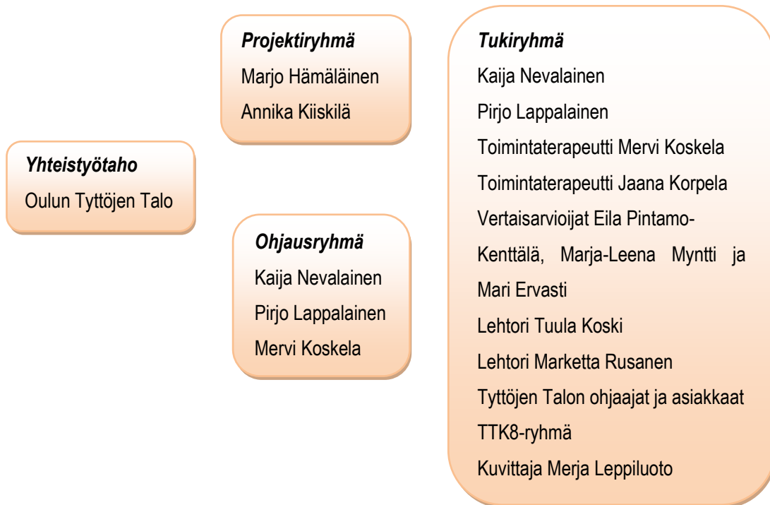
KUVIO 1. Projektioorganisaatio

Projektioorganisaatio perustetaan projektin toteuttamista varten määrääjäksi (Pelin 2009, 67). Siihen kuuluu muun muassa ohjausryhmä, projektiryhmä, tukiryhmä ja yhteistyöryhmä (Viirkorpi 2000, 25). Projektin organisoinnin tarkoituksena on, että kaikilla projektiin liittyvillä henkilöillä on selkeä käsitys omasta roolistaan. Projektioorganisaatio pyrkii yhdessä saavuttamaan projektin tavoitteet. (Karlsson & Marttala 2001, 76.) Projektioorganisaatioomme (kuvio 1) kuului henkilöitä Oulun seudun ammattikorkeakoulusta ja Oulun Tyttöjen Talolta.