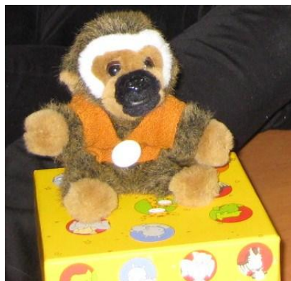
Kuva 2. mediapehmolelu

Keräsimme jokaisen toimintatuokion lopuksi palautetta lapsilta toimintatuokioiden aikana heränneistä tunteista, ajatuksista ja mielipiteistä tunnekuvien ja väittämien avulla. Jokaiselle tuokiolle olimme etukäteen laatineet viisi erilaista väittämää, joista halusimme saada palautetta lapsilta. Lapsilta saatu palaute auttoi kehittämään, suunnittelemaan ja arvioimaan toimintaa.