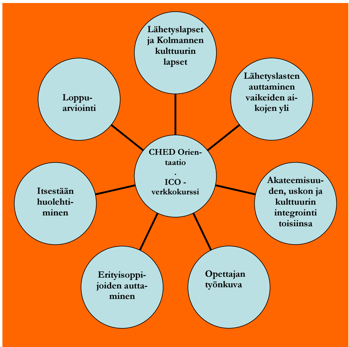
KUVIO 1. Kurssin jaksotus aiheiden perusteella. (ICO online –verkkokurssi 2012)

Alla on kaaviokuva kurssin jaksotuksesta (myötöpäivään):