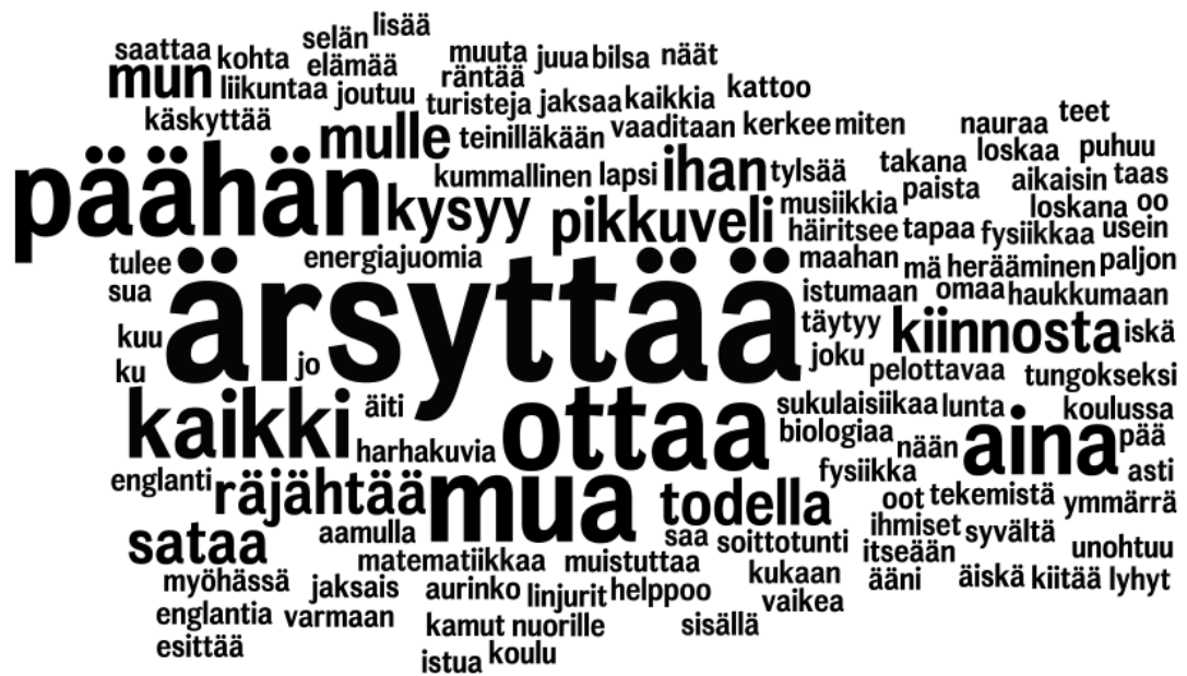
Kuva 2. Sanapilvi ärsyttävät asiat

Kolme sanoitusta oli vastannut suoraan kysymykseen, mikä ottaa päähän ja otsikoitu nimillä Kaikki ärsyttää sekä Mikä ärsyttää . Hienoa nuoruuden kuvausta tuli erityisesti näiden tekstien mukana. Epämääräinen ahdistus kiteytyy esimerkiksi seuraavissa lauseissa: Mutta niin kauheen ärsyttävää mua ärsyttää kaikki. Mut kuitenkin oon onnellinen jostain kumman syystä. Ärsyttäviä asioita olivat myös esimerkiksi se, ettei saa juoda energiajuomia tai ettei kukaan ymmärrä. Myös se, että äiti, kaverit tai opettaja tiedustelevat, mikä ärsyttää, ärsyttää!