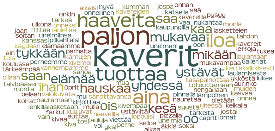
Kuva 3 Sanapilvi ilonaiheet