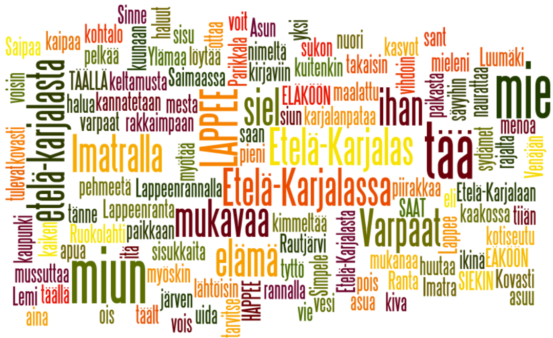
Kuva 1. Sanapilvi paikallisuus

kaimpaan ”. Paikallinen kiekko-seurakin sai huomiota: ” L niin kuin Lappee ja R niin kuin Ranta, siel’ kimmeltää vesi ja pehmeetä on santa. Sinne miun mieleni kovasti kaipaa, siel’ kannatetaan keltamustaa Saipaa. ” Vain tässä tekstissä puhekielenä oli oma murre. Luultavasti myös muun puhekielen kuin oman murteen käyttö tarjoaa suojan ja etäisyyden tuotettuun tekstiin. Maailmalle lähdöstä haaveillaan mutta kotiseutu ei kuitenkaan unohdu ja sinne kenties palataan. Yllättävän vähän puututtiin Kaakkois-Suomessa runsaasti näkyvään venäläisturismiin, sillä vain yksi teksti mainitsi turisteja tungokseen asti . Lapset ovat kenties suvaitsevaisempia heitä kohtaan kuin aikuisväestö.