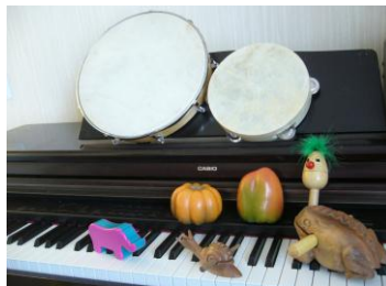
Kuva 2. Tästä on hyvä jatkaa, soitinkuva Sonetan sivulta ”Tarjottavat palvelut”.

Ajatukseni palveluntuottamisen alkutaipaleesta on kova, olenhan itsekin pienyrittäjäperheen lapsi. Omalla toiminnallaan pitää tehdä itseään näkyväksi. Käytännössä uutena yrittäjänä tulee kartoittaa ensimmäisten kuukausien realiteetit starttirahahakemukseen, ottaa selvää mahdollisista yhteistyökumppaneista, tiedustella ja esittää pyyntöjä apurahahankinnoista ja mahdollisesti näihin liittyen pitää esitelmäluentoja musiikkiterapiasta. Tietoisuus alastani kasvaa vähitellen ja oma asiakaskunta karttuu. Näin pääsee tekemään itse työtä, musiikkiterapiaa.