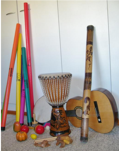
Kuva 1. Soitinkuva Sonetan sivulta ”Kohderyhmät”.

työssä käyttämiäni soittimia ja lapsia, joiden vanhemmilta sain luvan kuvien julkaisemiseen. Musiikkiesityksiin on valittu aiemmin otettuja valokuvia aidoista esiintymistilaisuuksista. Valokuvia on muokattu tietokoneen kuvaohjelmalla näkyvyyden parantamiseksi vaaleammiksi.