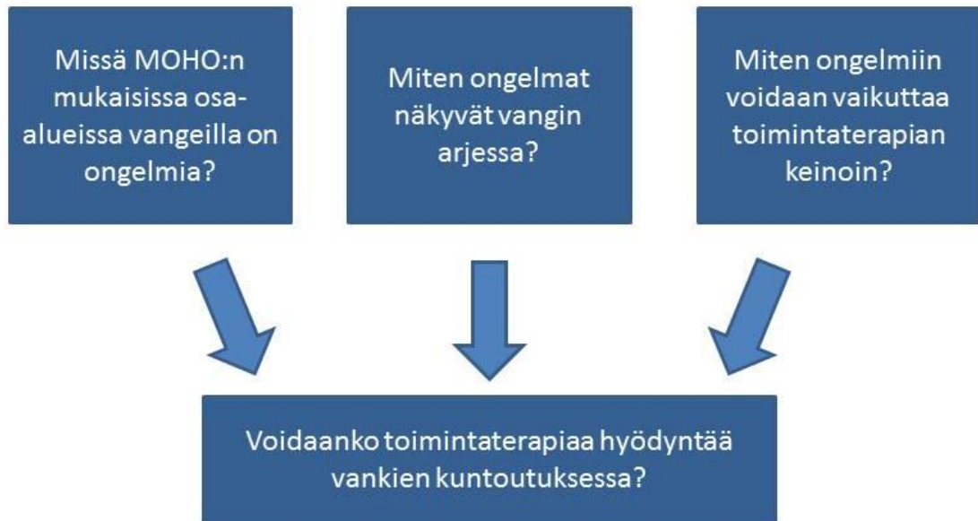
Kuvio 1. Opinnäytetyön kysymykset.

Tämän opinnäytteen tarkoituksena on antaa tietoa vankilassa toimivan toimintaterapeutin työkuvasta muiden alojen toimintaterapeuteille, opiskelijoille sekä vankiloiden ja vankisairaaloitten henkilökunnalle. Vankeinhoidossa työskentelevät toimintaterapeutit puolestaan saavat mahdollisesti uusia näkökulmia omaan työhönsä. Tietoisuus toimintaterapian sisällöstä ja mahdollisuuksista sekä sen tarpeellisuuden perustelu osaltaan edistävät uusien toimintaterapeutin virkojen saamista vankeinhoitoon. Työ auttaa myös opinnäytteen tekijöitä ymmärtämään toimintaterapian mahdollisuuksia laajemmin alalla, jossa toimintaterapeutteja on tällä hetkellä valitettavan vähän. Opinnäytetyön toivotaan vähentävän negatiivisia ennakkoluuloja vankeja kohtaan sekä lisäävän ymmärrystä heidän kuntouttamisensa tärkeydestä.