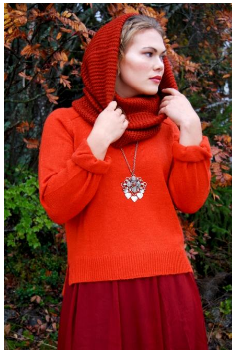
Bild 15. Rödluvan i skogen