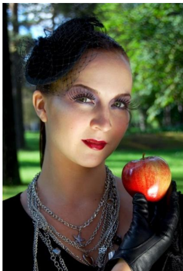
Bild 4. Närbild på den elaka styvmodern i sagan om Snövit