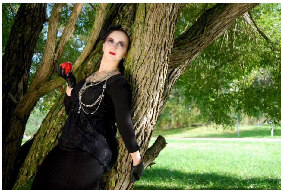
Bild 6. Den elaka styvmodern smyger i skogen