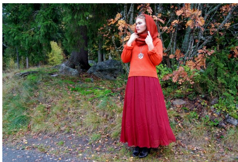
Bild 13. Rödluvan på väg till sin mormor

Håret är lite rufsigt och slarvigt uppsatt, vilket visar att Rödluvan har rört sig utomhus i vinden och kanske fastnat i någon kvist. Hårets rufsighet tyder också på att hon har haft på sig sin älskade luva. Flätorna runt huvudet ger intryck av att det är en ung flicka på bilden. Sminket ville vi hålla så naturligt som möjligt. Hyn är jämn och har en fin lyster. Kinderna är rosiga, vilket ger ett intryck av att hon har varit utomhus mycket. Vi framhävde modellens ansiktsdrag med en glansig highlighter och applicerade endast ett rosa läppglans på läpparna. Ögonsminket är neutralt med en ljusbrun ögonskugga som diskret förstärker ögonens form och endast ett lager mascara. Vi ville att stylingen skulle vara snygg och modern, därför valde vi bort luvan och klädde istället modellen i en tubscarf som fungerar som en huva. De murriga, rödbruna tonerna gör att hon ser vänlig och jordnära ut och de stickade materialen bidrar till att hon ser ut som om hon jobbar flitigt utomhus. För att stylingen skulle få en ungdomlig känsla satte vi till ett stort halsband med en sten i liknande orange ton.