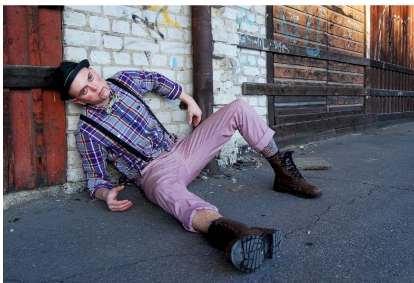
Bild 10. Pinocchio är vilshet och uppgiven

Pinocchio är en trädocka utan hår, därför valde vi en snaggad modell. För att få modellen att se ut som en trädocka drog vi lodräta linjer från mungiporna ner till hakan. Ögonen ser utskurna ut tack vare de skarpa skuggorna och rougen ser påmålad och onaturlig ut. Vi klädde modellen i olika brokiga färger och mönster. I bilderna har Pinocchio slitna skor och han använder hängslen för att de upphittade byxorna är för stora. Som accessoarer användes hatt och fluga. Den oroliga helheten representerar också hur olydig och lögnaktig Pinocchio är.