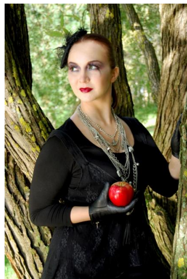
Bild 5. Den elaka styvmodern och det förgiftade äpplet