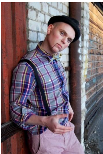
Bild 11. En lögnaktig trädocka