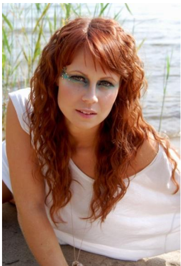
Bild 1. Närbild på den lilla sjöjungfrun