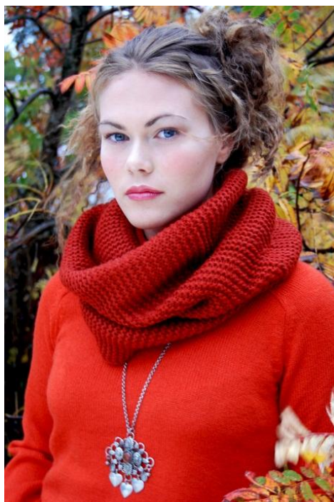
Bild 14. Närbild på Rödluvan