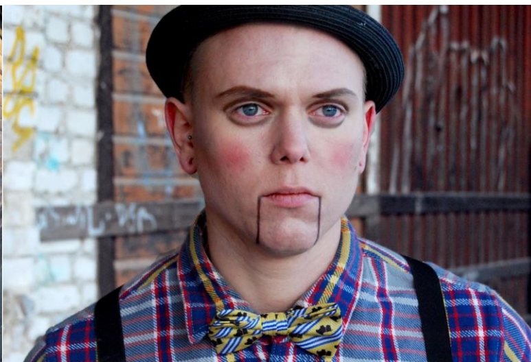
Bild 12. Närbild på Pinocchio