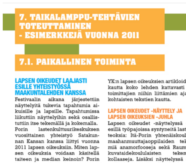
Kuva 4. Kuvassa eri otsikkotasot.

Jätin väliotsikoille yhden tyhjän rivin yläpuolelle, mutta laitoin sen kiinni kappaleeseen johon väliotsikko viittaa. Tämä ratkaisu loi tiiviyttä tekstiin ja loi selkeän eron edelliseen kappaleeseen. Tilanteissa joissa kaksi ylintä väliotsikkotasoa oli tekstissä peräkkäin ylimmän ja alimman välissä oli yksi riviväliä, mutta alin otsikkotaso oli kiinni tekstissä.