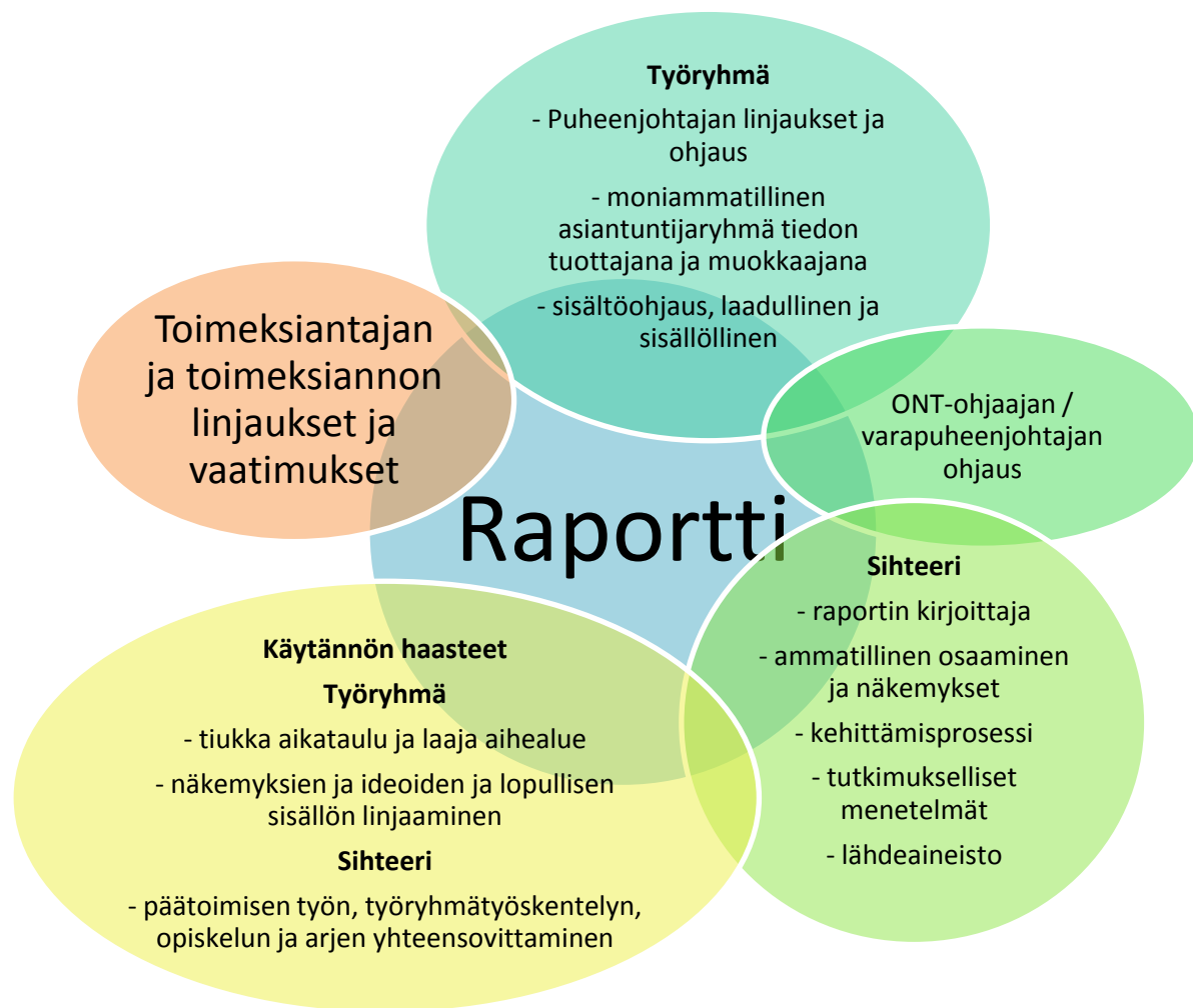
Kuva 4: Työryhmäraportin sisällön muodostumista ohjanneet tekijät