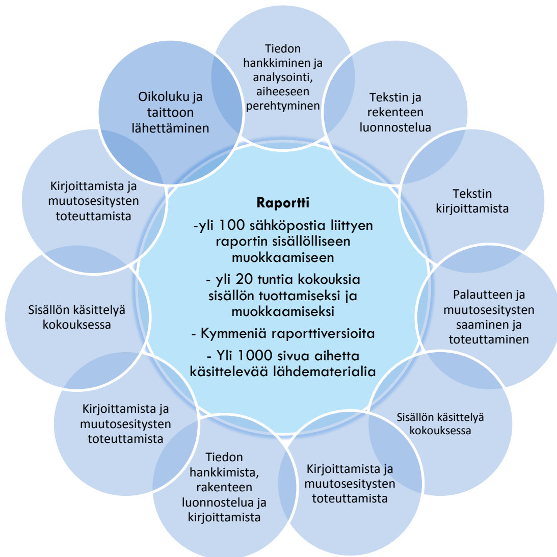
Kuva 3: Työryhmäraportin kirjoittamisprosessi