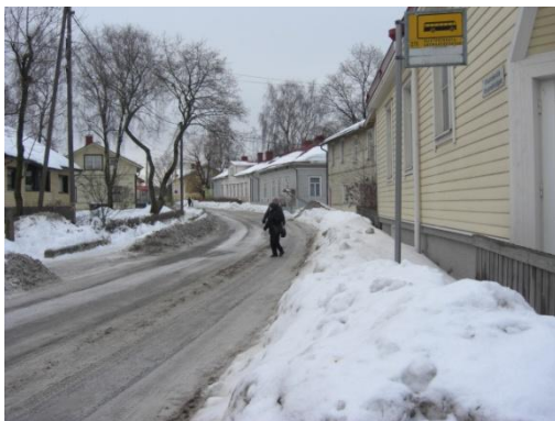
Kuva 6. Virusmäentie.