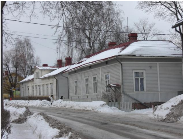
Kuva 11. Virusmäentie.

Virusmäentie on ollut tärkeä Raunistulan elämän keskus. Sen varrella on ollut monenlaisia yrityksiä vuosien aikana. Vielä nytkin se on eläväinen ja sen varrella on lounasravintola ja kahvila Navetta sekä Teatteri Tarmo. Taulu 4 kuvaa elämää Raunistulassa yleisesti. (Kuva 11)