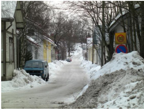
Kuva 5. Virusmäentie.

Taulu asetetaan Virusmäentielle (kuvat 5 ja 6) kohtaan, johon pieni kuja Tampereentieltä johtaa. Virusmäentie on yksi Raunistulan pääteitä ja sen varrella sijaitsee kahvila Navetta, jossa voi nauttia lounasta. Sen lisäksi tien molemmin puolin on vanhoja puutaloja. Virusmäentie on kapea ja mutkainen. Entisen työläiskorttelin tunnelmaan on mahdollista samaistua Virusmäentien ympäristössä.