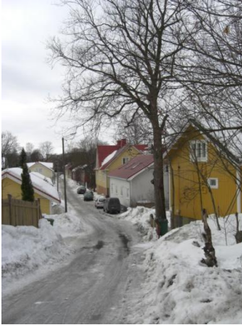
Kuva 10. Suutarinkatu 1.