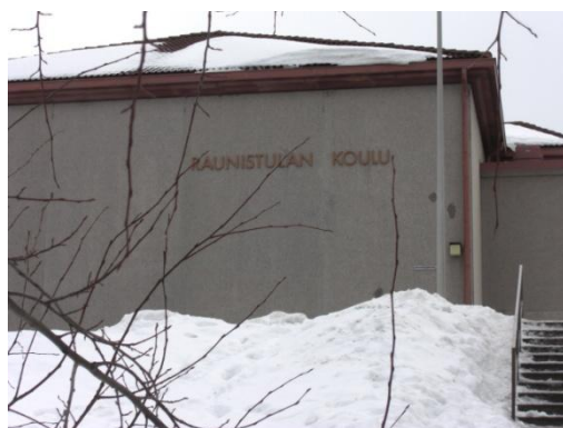
Kuva 2. Raunistulan koulu.

Kierros alkaa Raunistulan koululta. Taulu sijoitettaisiin koulun portaille. Kuvassa alla on kuvattu kyltin paikka ja sen kohdalta avautuva näkymä (Kuva 2-3). Taulu sijoitetaan siten, että se on kulkureitin varrella ja sen kohdalta näkee koulun hyvin. Taulu ei kuitenkaan ole koulun pihalla, jossa lapset viettävät välitunteja. Näin saadaan taululle pitkäikäisyyttä, kun taulu on ohikulku- eikä ajanviettopaikalla. Jos matkailijat saapuvat autolla, voi auton jättää koulun viereiselle parkkipaikalle ja kierrosta voidaan jatkaa jalan. Taulun tekstin sisältö liittyy Raunistulan koulun historiaan ja koululaisten kokemuksiin.