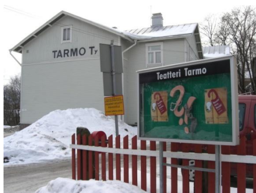
Kuva 7. Tarmo.

Työläisten Tarmo -taulu yhdistää tässä työssä esitettävät kierrokset. Taulu on järjestyksessään kolmas taulu lapsiperheille suunnatussa tuotteessa ja toisessa tuotteessa se aloittaa kierroksen (kuva 1). Tarmo ja yhteisöllisyys ovat tärkeä osa Raunistulan luonnetta. Se soveltuu sekä lapsien ja lapsiperheiden, että nuorten ja poikamiesten elämään. Tarmo, sekä muu yhteisöllinen toiminta, yhdisti kaikki raunistulalaiset. Taulu sijoitetaan Tarmon olemassa olevan info-taulun viereen (kuva 7). Siitä voi katsella Tarmon tulevia tapahtumia ja rakennuksessa toimivan Teatteri Tarmon ohjelmistoa.