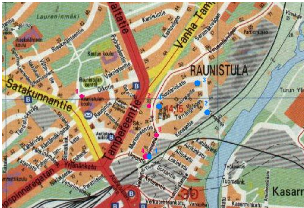
Kuva 1. Numeroidut infotaulujen paikat Raunistulassa.

suunniteltu siten, että sen voi tehdä itsenäisesti kartan avulla. Kuvassa alla (Kuva 1) kierroksen taulujen paikat on merkitty pinkin värisillä palloilla ja numeroitu. Kierros alkaa taulun numero yksi kohdalta ja päättyy numeroon neljä. Kierrokseen menee aikaa noin tunti, jos kierroksen kävelee rauhallista kävelyvauhtia ja pysähtyy lukemaan taulut.