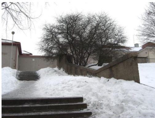
Kuva 3. Raunistulan koulun portaat.

Koulun pihalla voi pelata ja leikkiä mainittuja välituntipelejä. Matkaa jatketaan kävelemällä koulun ohi, puistoalueen läpi. Tielle nimeltä Kansakoulunkujanne (kuva 1) mennään koulun takaa pientä rinteä alas. Kansakoulunkujanne on yleinen reitti Raunistulan koululaisille ja se johtaa Tampereentielle. Rinteeseen on rakennettu seinämiä estämään ilmeisesti maanvyöryä (Kuva 4). Nämä seinämät eivät ole maisemallisesti kiinnostavia. Niihin saisi helposti ajankohtaisen ja kiinnostavan urbaanin hengen graffiti- maalauksilla. Graffitit voisivat liittyä lasten elämään alueella. Tällöin ne sopisivat ympäristöönsä ja kierrokseen. Reitti ylittää Tampereentien ylikulkusillan kautta. Tampereentiellä havaitaan, kuinka vilkkaan tien lapset ylittivät joka aamu. Tien ylitys on monen entisen raunistulalaisen koululaislapsen muistoissa. Matka jatkuu Virusmäentielle, jossa sijaitsee reitin toinen infotaulu.