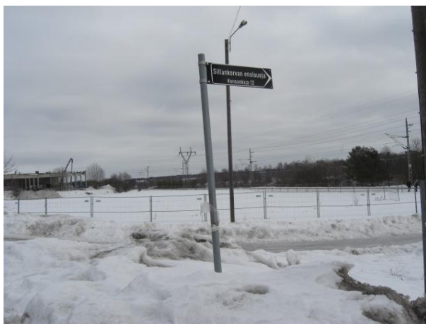
Kuva 9. Sillankorvan risteys.

Matka Työläisten Tarmo –taululta jatkuu Konsantietä pitkin junaradanvarrtta. Tästä voidaan katsella Raunistulan reunaa ja puutalorivistöä. Turku 2011 – säätiön teettämässä kaupunginosakyselyssä yksi raunistulalainen tahtoi näyttää turisteille Konsantien radanvarsikävelyn ja puutalorivistön. Taulu 2 kuvaa kieltolain vaikutuksia ihmisten arkeen osittain humoristissävytteisesti. Taulu asetetaan kohtaan, josta näkyy Sillankorva, joka on kodittomille alkoholisteille tarkoitettu väiaikainen asumisyksikkö (Kuva 9). Taulun sijainti on kuitenkin aika kaukana talosta, eivätkä sen kohdalla seisovat turistit näin ollen häiritse talossa yötään viettäviä.