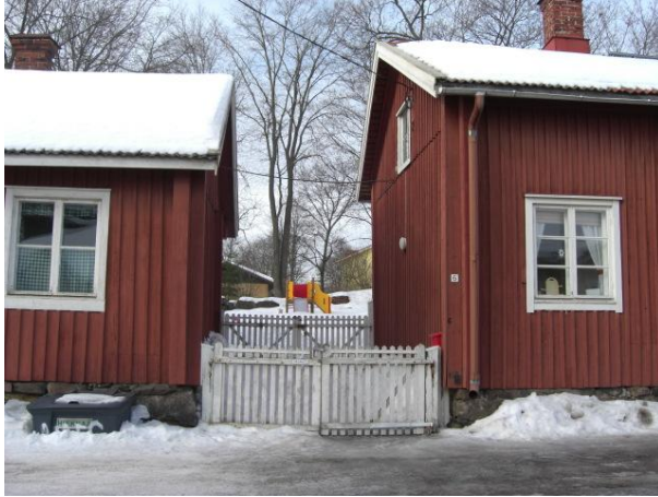
Kuva 8. Raunistulan Seimi.

(kuva 8). Tästä kohdasta näkee jo rautatien ja Aninkaistensillan, joten poistuminen on helppoa.