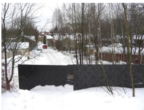
Kuva 4. Seinämät rinteessä.

Koulun pihalla voi pelata ja leikkiä mainittuja välituntipelejä. Matkaa jatketaan kävelemällä koulun ohi, puistoalueen läpi. Tielle nimeltä Kansakoulunkujanne (kuva 1) mennään koulun takaa pientä rinteä alas. Kansakoulunkujanne on yleinen reitti Raunistulan koululaisille ja se johtaa Tampereentielle. Rinteeseen on rakennettu seinämiä estämään ilmeisesti maanvyöryä (Kuva 4). Nämä seinämät eivät ole maisemallisesti kiinnostavia. Niihin saisi helposti ajankohtaisen ja kiinnostavan urbaanin hengen graffiti- maalauksilla. Graffitit voisivat liittyä lasten elämään alueella. Tällöin ne sopisivat ympäristöönsä ja kierrokseen. Reitti ylittää Tampereentien ylikulkusillan kautta. Tampereentiellä havaitaan, kuinka vilkkaan tien lapset ylittivät joka aamu. Tien ylitys on monen entisen raunistulalaisen koululaislapsen muistoissa. Matka jatkuu Virusmäentielle, jossa sijaitsee reitin toinen infotaulu.