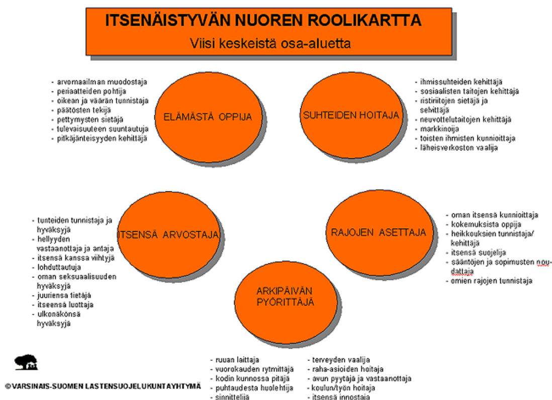
Kuva 1. Itsenäistyvän nuoren roolikartta, Varsinais-Suomen lastensuojelukuntayhtymä, 2011.

Varsinais-Suomen lastensuojelukuntayhtymä on kehittänyt itsenäistyvän nuoren roolikartan, joka (kuva 1) havainnollistaa selkeällä tavalla nuoren maailmassa tapahtuvia muutoksia