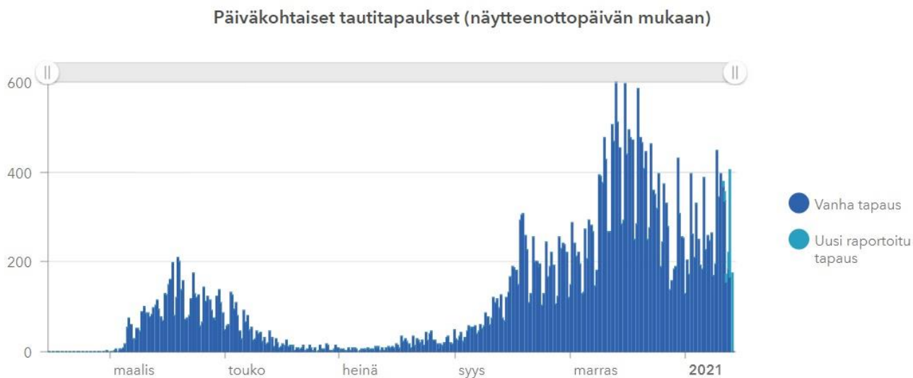
Kuvio 2: Päiväkohtaiset tautitapaukset Suomessa.