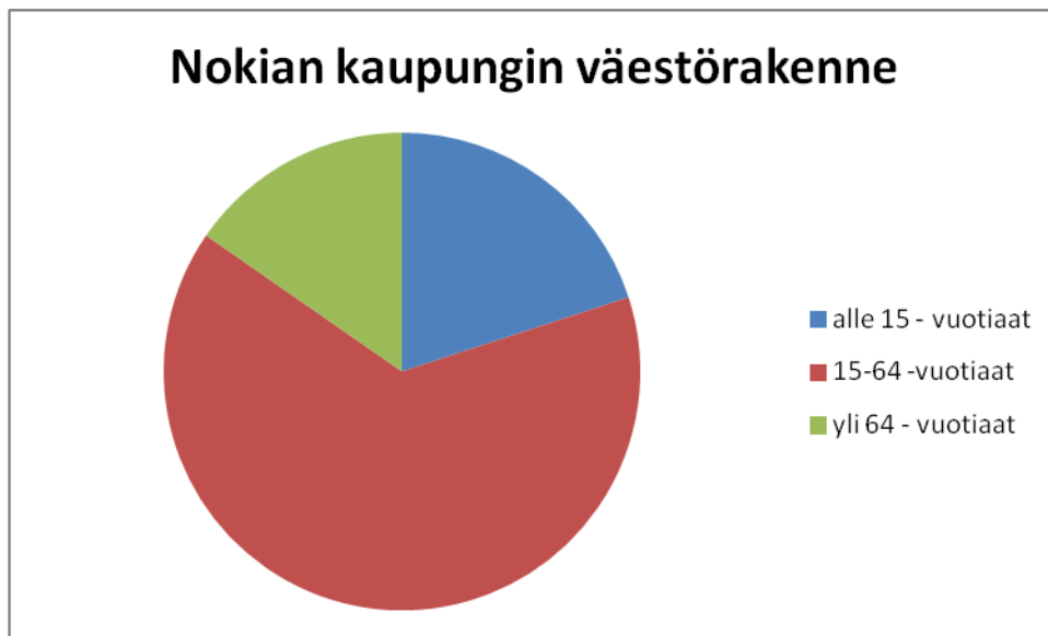
KUVIO 1. Nokian kaupungin väestörakenne vuonna 2010.

Nokiasta tuli kaupunki vuonna 1977. Nykyisin Nokian kaupunki on kasvava, kehittyvä, eteenpäin menevä ja muuttovoittoinen kaupunki. Nokialla asuu tällä hetkellä n. 31 000 asukasta. Nokian kaupungissa on v. 2010 tilastojen mukaan 20 359 15–64-vuotiaasta asukasta. Alle 15-vuotiaita asukkaita on 6 286 ja yli 64-vuotiaita 4 834 asukasta. Vuonna 2010 Nokialle muutti 1764 henkilöä ja väestö lisääntyi 289 henkilöllä. (Tietoja Nokiasta 2011.)