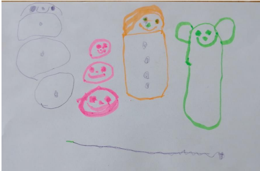
Kuva 6. ”Martta, varamartta, isä, äiti ja mä. Mä tein isille lumiukon.”

Kuvan kuusi on piirtänyt ”lapsi 4”, jonka sitaatti on kuvan edellä. Kuvaansa hän on piirtänyt oikeasta reunasta alkaen vihreällä lemmikki mäyräkoiransa Martan. Seuraavana kuvassa on hänen ”vara-Martta”, joka on heidän koiransa kanssa samannäköinen pehmolelu. Vaaleanpunaisella lapsi piirsi perheensä: isän, äidin ja itsensä. Lisäksi lapsi piirsi vasempaan reunaan lumiukon. Hän kertoi piirtävänsä sen isälleen. Piirtämisen aikana lapsi kertoi paljon Martta-koirastaan. Hän sanoi, että kun koirasta valuu kuolaa, äiti siivoaa. Hän kertoi myös Martalla olleen kerran juoksut ja siitä valuneen verta. Tarinaa löytyi myös naapurin koirasta, joka oli kuulemma Martan kaveri. Hän kertoi muun muassa sen rodusta, mitä koira tekee(lammaspaimen) ja kuinka ihanat kápälät sillä on.