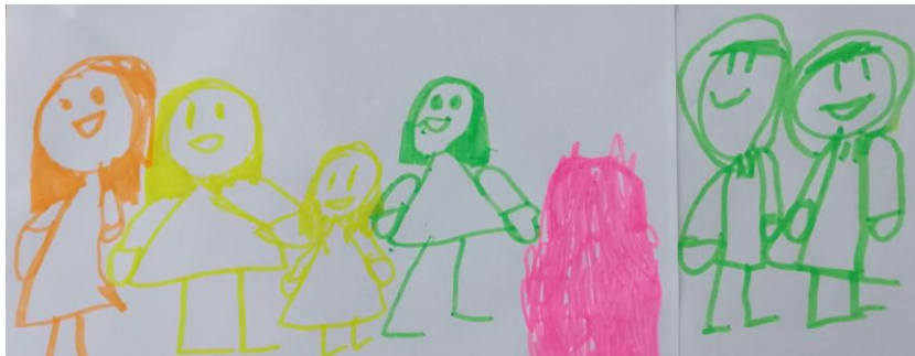
Kuva 4. ”Äiti, mä, sisko, sisko, veli ja iskä.”

Yksi lapsista (kuva 5.) piirsi kuvaansa itsensä, äidin, kaksi siskoa ja kissan. Kuvassa lapsi piirsi itsensä hieman erilleen muista. Hänelle oli piirretty erilaiset silmät ja s-mallinen suu, kun muut taas hymyilivät. Lapsi ei juurikaan puhunut haastattelun aikana perheestään.