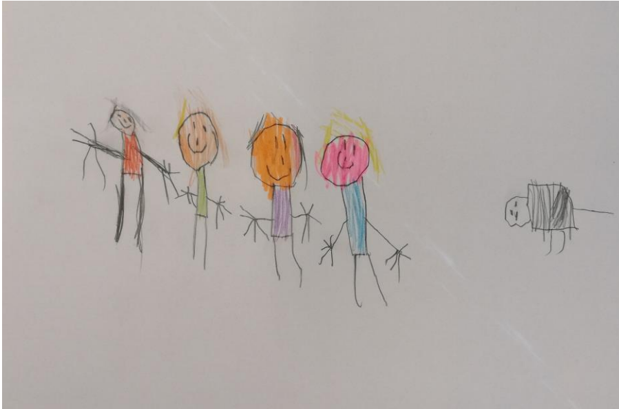
Kuva 7. ”Täs on meidän lemmikki Koda, se on kissa ja täs on minä ja täs on äiti täs on isä täs on sisko.”

Kuvassa 7. lapsi on piirtänyt kuvaansa äidin, isän, siskon, itsensä, sekä lemmikkikissan. Hän esitteli perheenjäsenistään ensimmäisenä lemmikin. Lapsi oli piirtämässä samanlaisesti kahden muun lapsen kanssa. Toiset lapset olivat äänekkäämpiä ja kommentoivat piirtämisprosessiaan jatkuvasti. Tämä lapsi ei puhunut piirtäessään mitään, eikä osallistunut haastattelutilanteen keskusteluun. Hän piirsi keskittyneesti ja kun hän oli saanut piirustuksensa valmiiksi, hän kertoi reippaasti, ketä oli kuvaansa piirtänyt.