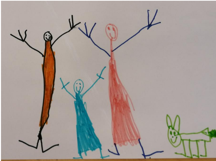
Kuva 1. "Toi on minä ja äiti ja koira ja Saku."

Lapsi 13: mä piirrän tänne alas ehkä isän