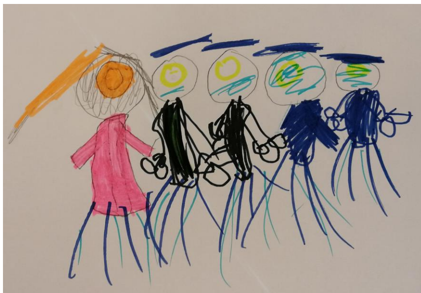
Kuva 3. ”Isoveli pinkissä mekossa, minä ja äiti mustissa mekoissa, isosisko ja iskä.”

Lapsi11: Isoveli pitää tehdä. Sil on näin iso pää. Sitten pitää tehdä veljelle silmät, yks iso silmä. Ja mun isoveljellä on peppu. Mun isoveljel on myös mekko mut sil ei oo ikinä ollu mekkoo. Noin nyt sil on nätti mekko. Nyt pitää tehdä mekko pinkillä.