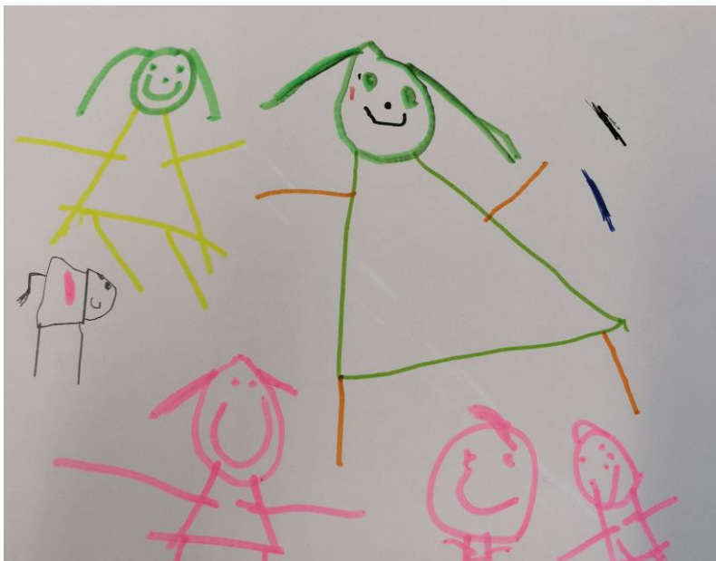
Kuva 2. "Minä äiti iskä ja pikkuveljet."

Kuvaan lapsi piirsi ensimmäisenä äitinsä ja itsensä. Äidin hän piirsi kuvaan keskelle ja suurimpana, ja itsensä äidin viereen. Tämän jälkeen, hän piirsi kuvan oikeaan alareunaan kaksi pikkuveljeään. Vasempaan reunaan hän piirsi koiran. Lopuksi lapsi pohti ääneen, piirtääkö kuvaansa isää vai ei. Kysytty, että miksi lapsi piirtää kuvaansa ehkä isän. Lapsi ei osannut tai halunnut vastata kysymykseen ja sanoi vain, ettei tiedä. Lopulta hän kuitenkin piirsi isänsä mukaan kuvaan alareunaan. Kysyessäni piirustuksessa tarkemmin, lapsi kertoi, keitä kuvassa on ja että kuvassa oleva koira on kuollut. Hän kuitenkin koki, että koira kuuluu heidän perheeseensä, eikä pohtinut sen mahdollisuuksia kuvaan pääsemiseen.