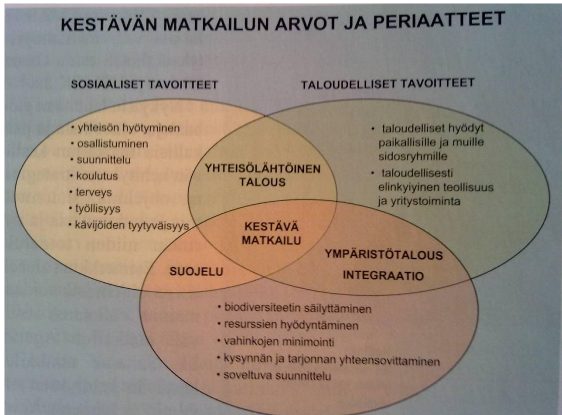
Kuvio 2. Kestävän matkailu arvot ja periaatteet (Hemmi 2005a, 82.)

Taloudellisten tavoitteiden avulla matkailualue hyötyy taloudellisesti ja pystyy näin ollen tarjoamaan lisää matkailupalveluita, sekä ympäristöllisten tavoitteiden avulla matkailualue suojelee ja ylläpitää matkailualuea, sen luontoa ja kulttuuria, jotta se pystyisi myös tulevaisuudessa tarjoamaan matkailijoille nähtävää ja koettavaa.