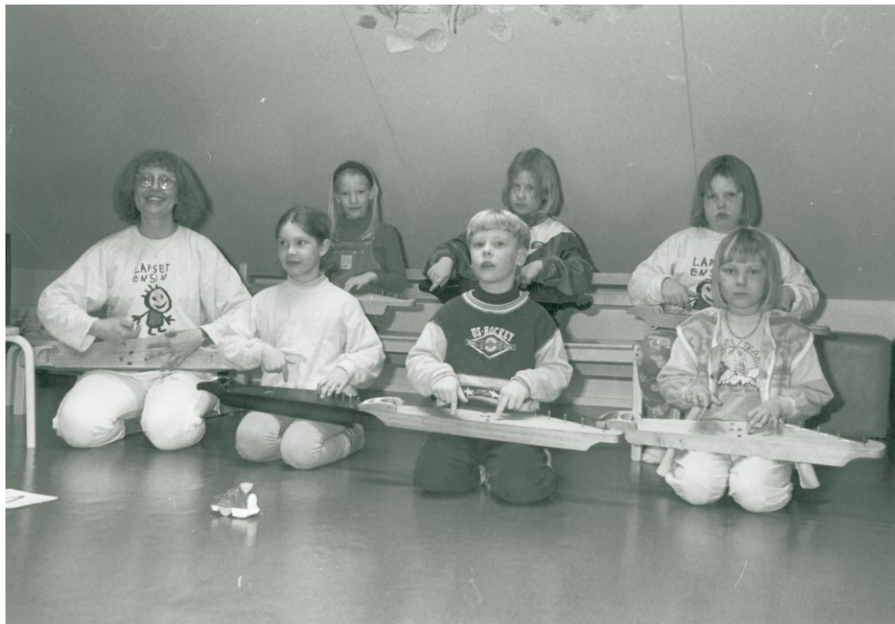
Kuva 2. Ahtaista tiloista huolimatta Vääksyn nuorisotalon vintillä koettiin musiikin tekemisen iloa.

Musiikkileikkikoulu muutti vuonna 2000 jälleen Asikkalassa: nyt sille osoitettiin tilat entisen ammattikoulun alakerrasta. Musiikkikoulutoiminta Lammilla ja Padasjoella jatkui entisellään, ja opetuksen rinnalle saatiin myös soitinvalmennusryhmiä pianossa, kitarassa, kanteleessa ja harmonikassa. Lukuvuonna 2001-2002 musiikkileikkikoulu vielä kerran vaihtoi toimipaikkaa: nyt muutettiin jälleen opistotalolle, tällä kertaa yläkerran musiikkiluokkaan. Syksyllä 2002 muskari joutui muuttamaan sieltäkin, ja syys lokakuu 2002 toimittiin Vääksyn yhteiskoulun alakerran luokassa.