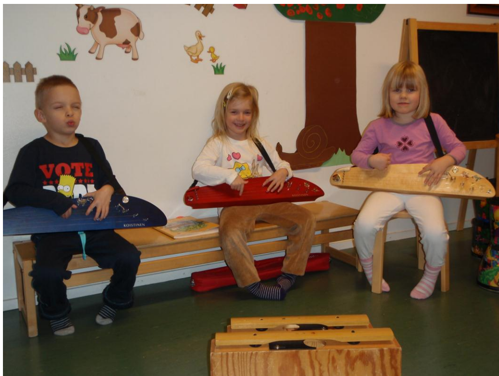
Kuva 9. Muskari antaa onnistumisen elämyksiä.

sanarytmi ja helpot muotorakenteet. Koska kaikki asiat opitaan kuuntelun avulla, lapsi oppii hyvin tarpeelliset taidot: hiljentymisen, kuuntelun ja keskittymisen taidot, jotka ovat keskeisessä asemassa muun muassa, kun lapsi aloittaa koulun.