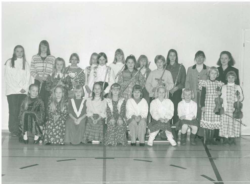
Kuva 5. Vuotta myöhemmin meitä oli jo näin monta!

viisi pianistia. Lisäksi käynnistettiin säveltapailu- ja teoriaopetus. Koska omia tiloja ei ollut, pääaineopetukseen saatiin tilat Vääksyn koululta. Asikkalan kunta ilmoitti heti, ettei se tule antamaan taloudellista tukea uudelle musiikkikoululle. Koska lukukausimaksut olivat ainoa tulolähde koululle, lukukausimaksuksi määriteltiin 1500 markkaa. Maksu oli selvästi korkeampi kuin ympäristökunnissa annettavan musiikkiopetuksen hinta, mutta omalla paikkakunnalla toimivalle musiikkikoululle tuntui olevan alusta asti suuri tilaus.