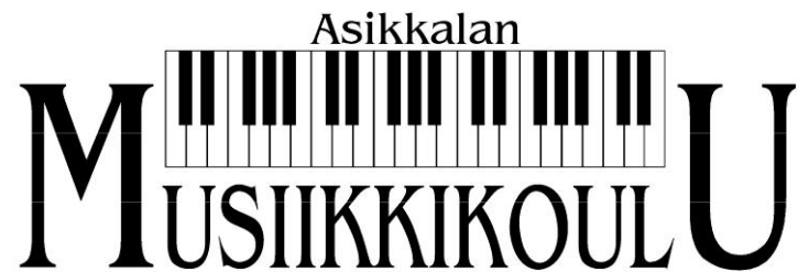
Kuva 3. Asikkalan Musiikkikoulun logo näytti näin tyylikkäältä.

Asikkalan Musiikkikoulun perustamisvaiheet ja kehitys tapahtuivat vähitellen vaihe vaiheelta, koska aikomukseni ei aluksi ollut perustaa musiikkikoulua muskarin jatkeeksi.