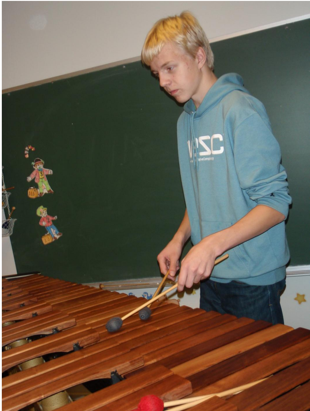
Kuva 7. Opetushallituksen avustuksella hankittiin opistolle mm. marimba.