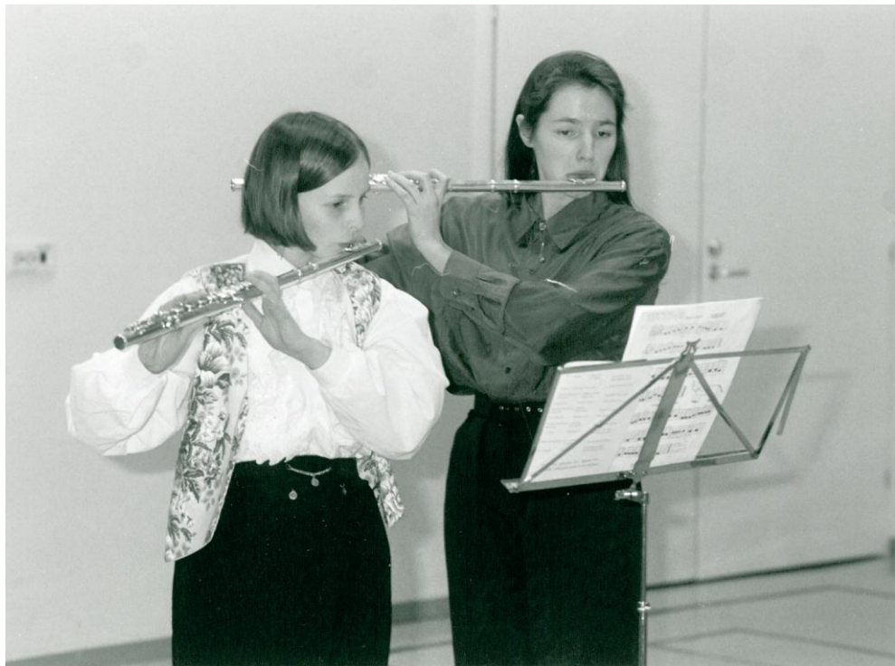
Kuva 4. Musiikkikoulussa aloitti vuonna 1994 opintonsa kahdeksan huilistia ja viisi pianistia.

Asikkalan Musiikkikoulun perustamisvaiheet ja kehitys tapahtuivat vähitellen vaihe vaiheelta, koska aikomukseni ei aluksi ollut perustaa musiikkikoulua muskarin jatkeeksi.