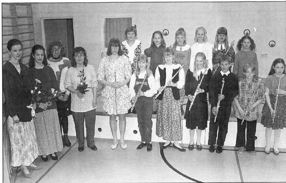
Asikkalan Musiikkikoulun opettajat ja koulun matineassa esiintyneet oppilaat kävivät illan päätteeksi tyytyväisin mielin yhteiseen kuvaan.

Musiikkikoulun lukukausi päättyy toukokuun lopussa. Uusi lukukausi alkaa