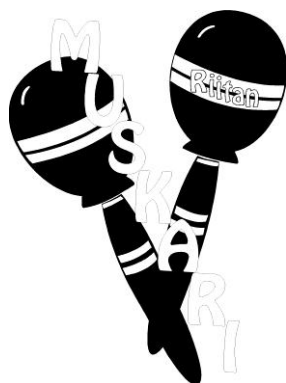
Kuva 1. Riitan muskarin logoa käytettiin muun muassa tiedotteissa ja collegepaidoissa.

Aloitin musiikkileikkikouluopetuksen Asikkalassa kansalaisopiston tiloissa edellä kuvatuista lähtökohdista. Muskaritoiminnasta tuli muutamassa