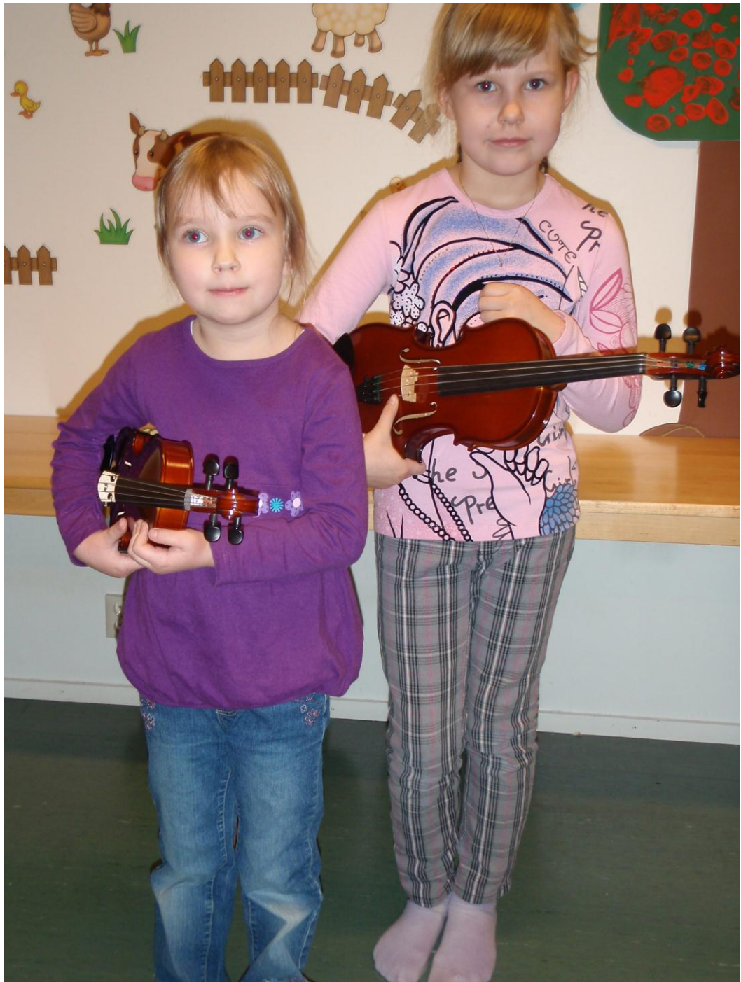
Kuva 6. Iloisia viuluvalmennusoppilaita.