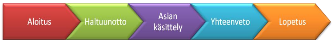
Kuvio 2. Palveluprosessin vaiheet. Mukailten Ylikoski & muut, 2006.

Tuotteiden ollessa eri toimijoiden keskuudessa lähes samanlaisia, on yritysten erot-tauduttava asiakkaan silmissä jollain toisella tavalla. Hintakilpailu on hyvin yleinen tapa, mutta siinä on riskinsä eikä se ole aina edes mahdollista. Someron Säästöpankki myy henkivakuutusyhtiö Duon säästövakuutuksia, joiden kulurakenne on ennalta määrätty eikä näiden muuttaminen ole mahdollista kilpailutilanteessa. Siksi tällaisissa tilanteissa tulee panostaa asiakaspalveluun osana myyntiprosessia. Hyvä asiakaspal-velu ja onnistunut markkinointi edesauttavat oikein toteutetun myyntiprosessin kanssa asiakkuuden kasvamisessa, mutta mikään näistä ei riitä yksistään samaan.