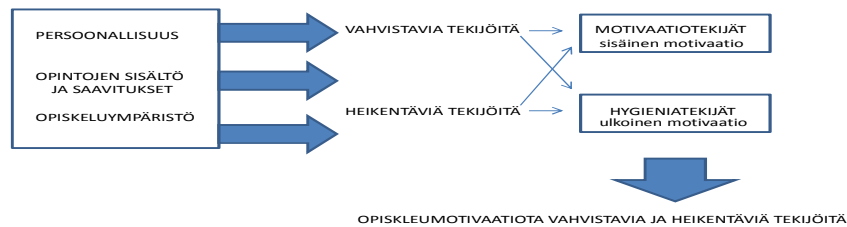
Kuvio 2: Aineiston analysointimalli

Opiskelumotivaation kokonaisuutta tarkastellaan persoonallisuuden, opintojen sisällön ja saavutusten sekä opiskeluympäristön osalta. Kuviossa 2. olen esittänyt analysointimallin, jonka mukaan teemahaastatteluaineisto on analysoitu. Lähden liikkeelle opiskelijoiden kokonaismotivaation käsittelystä. Tämän jälkeen käsittelen opiskelijoiden mainitsemat kolme motivaatiota vahvistavaa ja heikentävää tekijää, jotka ovat nousseet teemahaastattelun aikana esiin. Opiskelumotivaatiota vahvistavat ja heikentävät tekijät on jaettu Herzbergin motivaatioteorian motivaatio ja hygieniatekijöihin. Tämän jaottelun avulla on mahdollista saada selville opiskelijoiden motivaation rakennetta sisäiseen ja ulkoiseen motivaatioon liittyen. Tärkeimpänä lopputuloksena tässä työssä käsitellään opiskelumotivaatiota vahvistavia ja heikentäviä tekijöitä.