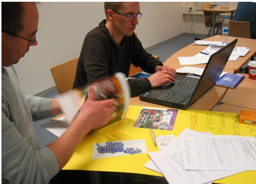
KUVA 2. Miten ohjaamme opiskelijoita oppimaan?

"Onko tämä nyt sitä mitä minä olen tehnyt? Onko tässä kenties jotakin uutta semmoista, mitä minä en ole aiemmin edes ajatellut? Mitä opiskelijoiden olisi hyvä oppia? Miten opiskelijoiden olisi hyvä oppia? Miten he oikeasti oppivat?"