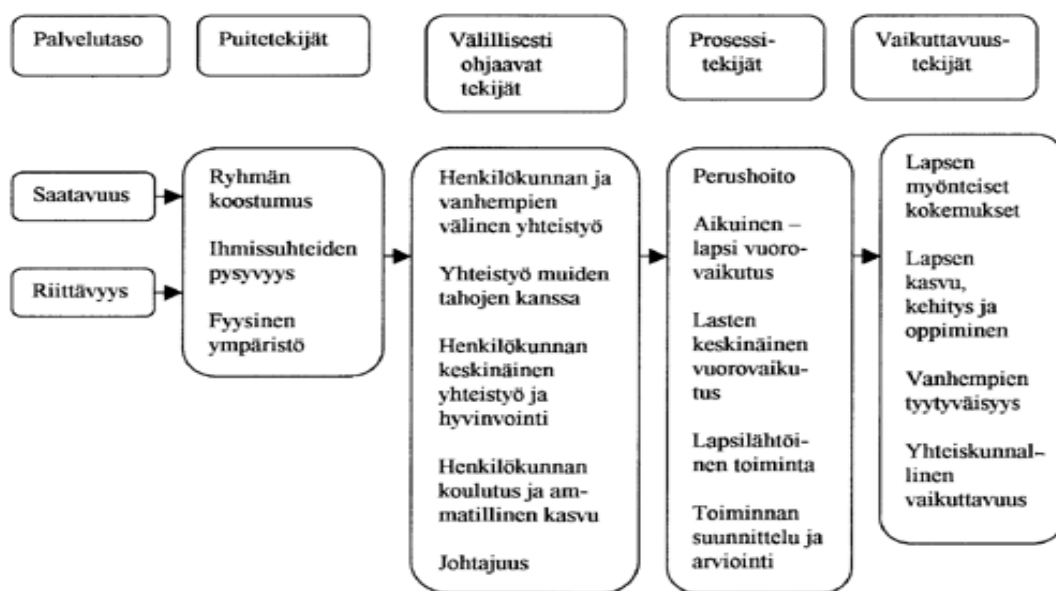
Kuva 1. Päivähoidon laadunarviointimalli (Hujala ym. 1999, 78)

kunkin tekijän osalta erikseen että kaikkien eri tekijöiden muodostamana kokonaisuutena, jolloin päivähoiton laatua voidaan arvioida kokonaisvaltaisesti. (Hujala ym. 2007, 162.)