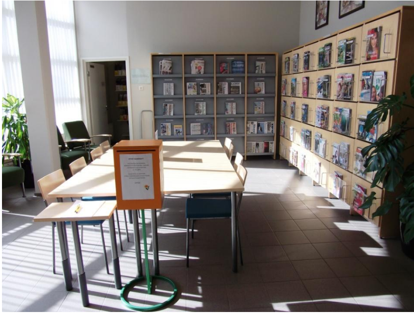
KUVA 3. Suomussalmen pääkirjaston lehtisali 5/2012.

Lähelle kirjaston muihin tiloihin johtavaa väliovea on sijoitettu asiakaspääte, jota voi käyttää ainoastaan verkkolehtien lukuun PressDisplay-tietokannassa. Lehtisalissa toimii myös langaton verkko.