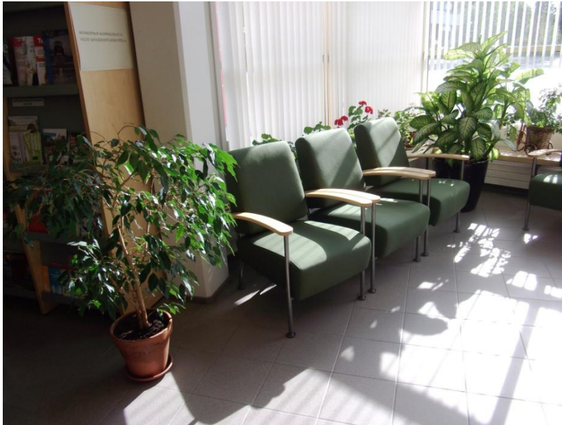
KUVA 2. Suomussalmen pääkirjaston lehtisalin sisustus 5/2012.

kirkasvalolampusta. Hyvää valoa saadaan myös kattolampuista. Tilaa elävöittävät viherkasvit ja lehtikaappien ylle sijoitettu taide.