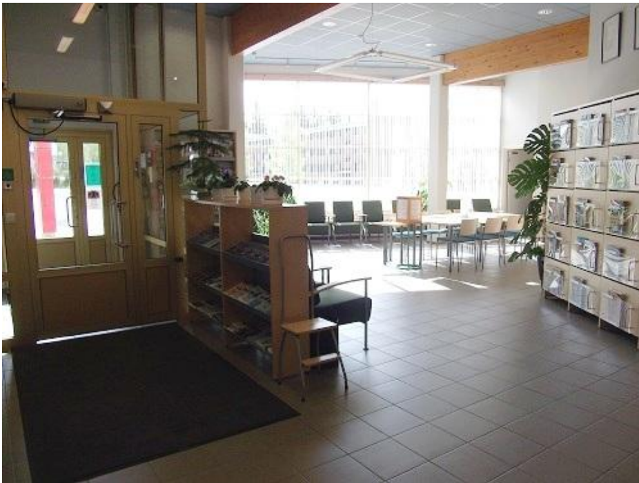
KUVA 1. Suomussalmen pääkirjaston lehtisalin pääsisäänkäynti ja lehtisali 5/2012.

Suomussalmen pääkirjasto sai uuden lehtisalin vuoden 2009 kirjastorakennuksen peruskorjauksen yhteydessä. Entisiin tiloihin verrattuna Suomussalmen pääkirjaston lehtisali on keskeisemmällä paikalla eli heti pääoven läheisyydessä (Kuva 1). Näin ollen salia voidaan pitää aamuisin auki kaksi tuntia ennen muun kirjaston aukeamista.