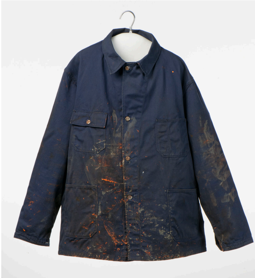
Kuva 10. Ajan ja käytön aiheuttamaa patinaa sinisessä 1960-luvun työtakissa.