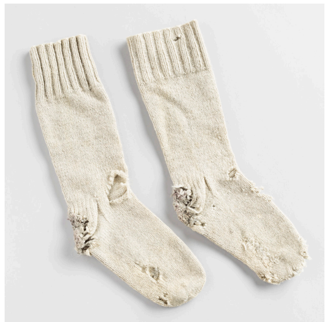
Kuva 11. Osin parsitut ja osin rikkiäiset villasukat. Seurasaaren ulkomuseon kokoelmat.