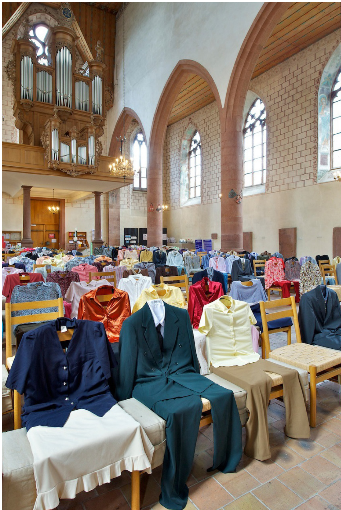
Kuva 6. Kuubalaisen taiteilijakollektiivi Los Carpinterosin installaatio: 150 People (2012).