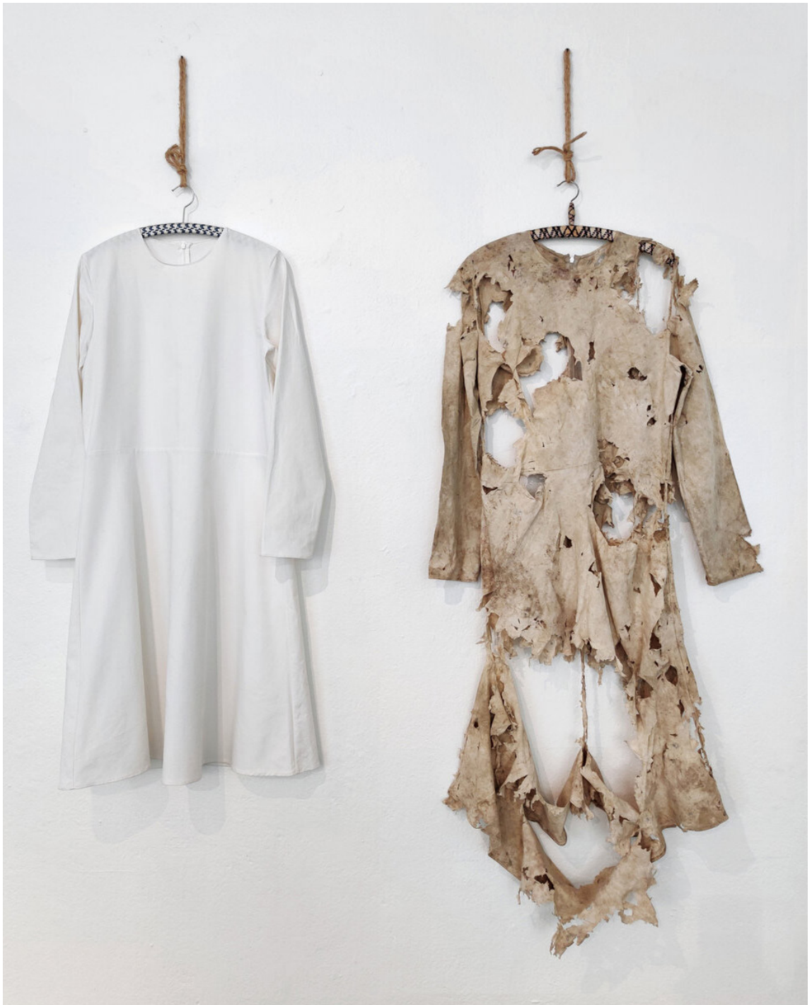
Kuva 1. Elina Laitinen: Sometimes you should just bury a garment in the ground and enjoy that feeling, 2020.