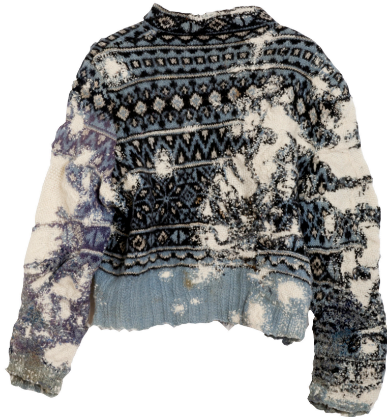
Kuva 8. Tikkurineule. Suomen käsityön museo. Kuva 9. Taiteilija Celia Pymin paikkaama villapaita.