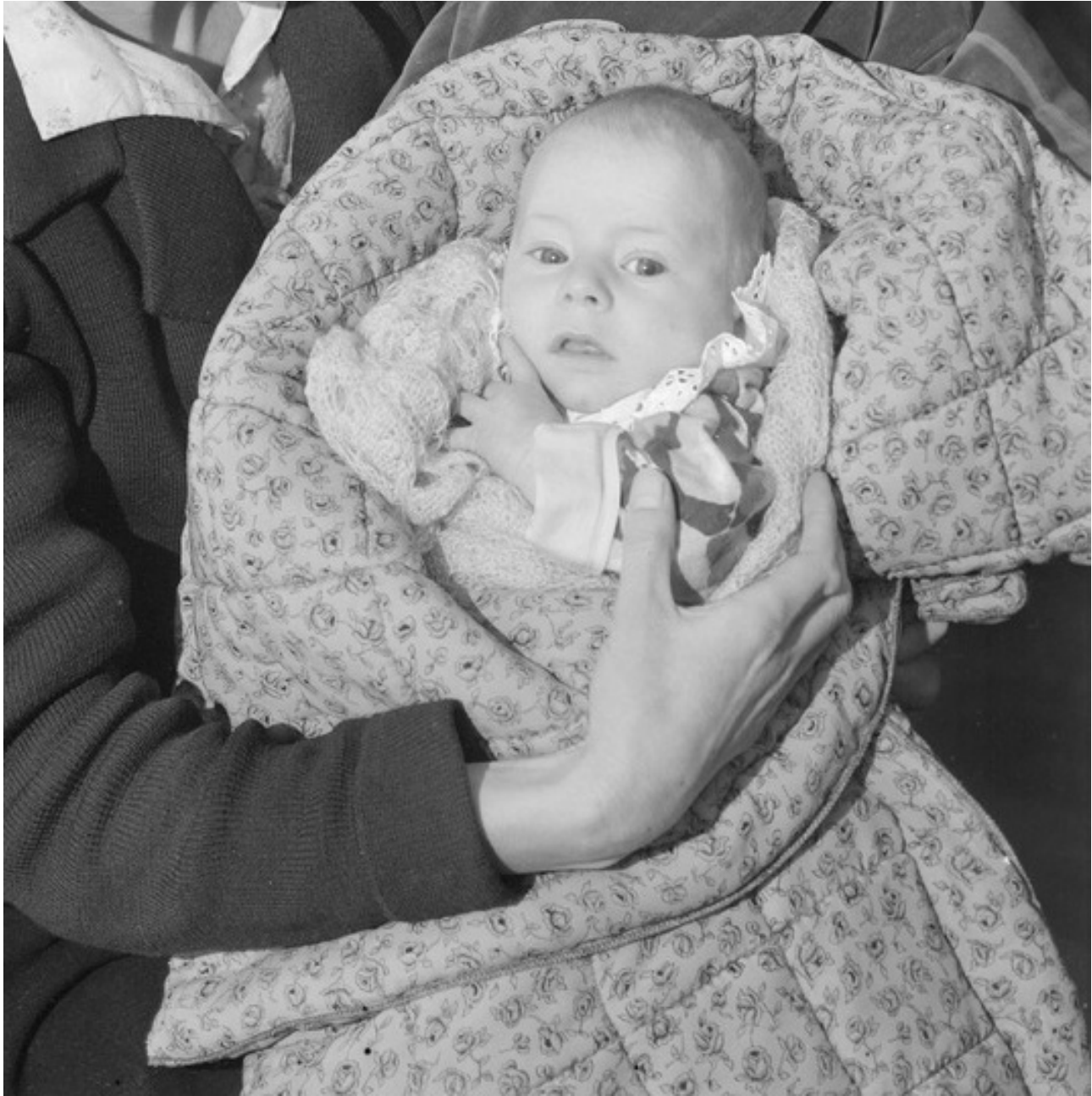
Kuva 7. Varhainen kokemus tekstiilien, vaateen, kosketuksen ja hoivan yhteydestä. Kuva: Äiti ja vauva. Viljo Pietinen, 1942. Historian kuvakokoelma: Pietisen kokoelma.