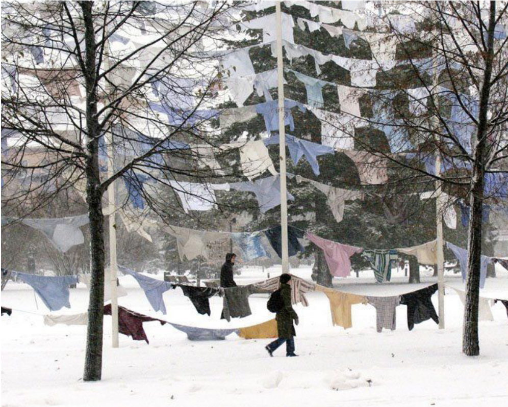
Kuva 14. Kaarina Kaikkonen: Virtaavien vetten tykö, 2006.