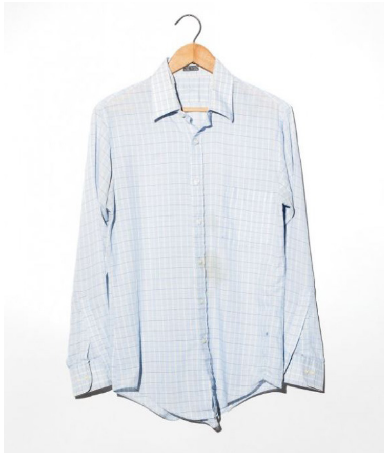
Kuva 12. Spivack, 2014. Worn Stories. 15.