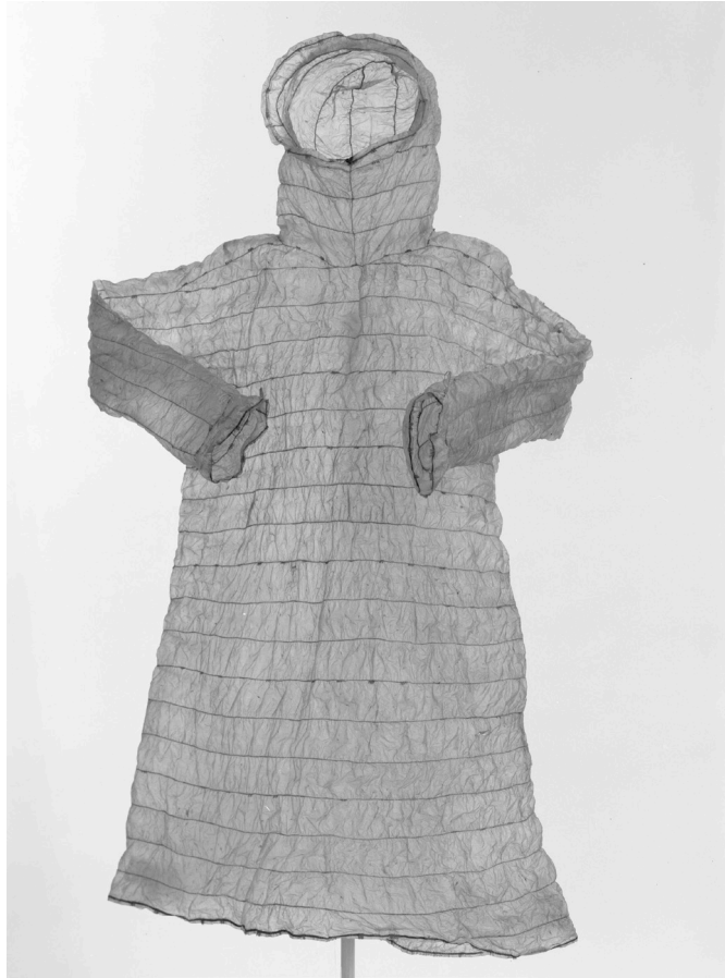
Kuva 4. Merieläimen suolista ommeltu metsästysvaate. Valmistusaika ennen vuotta 1859. Kansallismuseo: Yleisnografiset kokoelmat.

On kuitenkin myös esimerkkejä, joissa sääolosuhteet ovat vaikuttaneet pukeutumiseen. Esimerkiksi Pohjois-Afrikan beduiinit ovat käyttäneet paksua vaatekappausta kuumalta auringolta suojautuakseen. Kylmät olosuhteet eivät siis ole automaattisesti merkinneet tekstiilien runsasta käyttöä tai lämpöisyys niiden vähäisyyttä. Suojautuminen ei kuitenkaan liity vain ympäristön olosuhteilta, kuten säältä tai hyönteisiltä suojautumiseen, sillä esivanhempamme ovat usein eläneet lämpimissä tai kylmissä olosuhteissa hyvin erilaisin pukeutumistavoin. (Storm 1987, 70–72.)