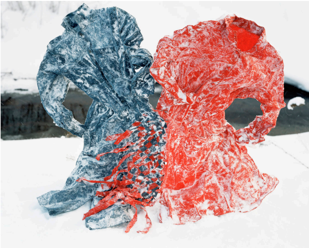
Kuva 15. Riitta Päiväläinen: Relation, 2001