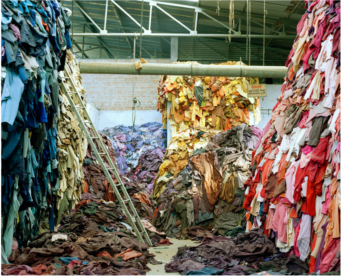
Kuva 2. Tim Mitchell. Clothing Recycled in Panipat.

semme, joudumme uudelleen tarkastelemaan myös omaa suhdettamme jo olemassa olevaan materiaan sekä muodostamaan vaihtoehtoisia tapoja valmistaa, omistaa, vaalia ja käyttää vaatteitamme. Vaatemuistojen ja -tarinoiden esiin nostaminen on yksi keino tarkastella, millaisin tavoin vaatteisiin suhtaudumme, mikä tekee vaatteesta erityisen ja miksi vaatteet ovat meille niin tärkeitä?