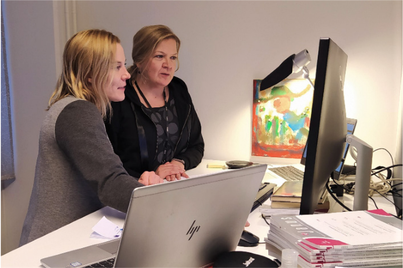
KUVA 1. Oamkin lehtorit toteuttamassa interaktiivista opetusta Saksaan

Lehtoreiden tavoitteena oli opiskelijälähtöisyys ja sen vuoksi käytettiin soveltaen interaktiivista opetusmenetelmää. Se voidaan nähdä aktivoivana pedagogiikkana, jossa opettaja-opiskelijasuhteella on tärkeä asema. Tavoitteena on edistää opiskelijoiden osallistumisaktiivisuutta ja mahdollisuutta vaikuttaa omaan opiskeluunsa. Opettaja pyrkii tähän muun muassa luomalla hyväksyvää ilmapiiriä ja olemalla helposti lähestyttävä. [2] Opetuksen suunnittelu ja toteuttamisvaiheessa kiinnitettiin huomiota oppimiskokemuksen hyödyllisyyteen, opiskelijoiden mahdollisuuksiin keskustella, työskennellä pienryhmissä ja vaikuttaa opetuksen sisältöön. Myös opettajien helposti lähestyttävyyteen kiinnitettiin huomiota.