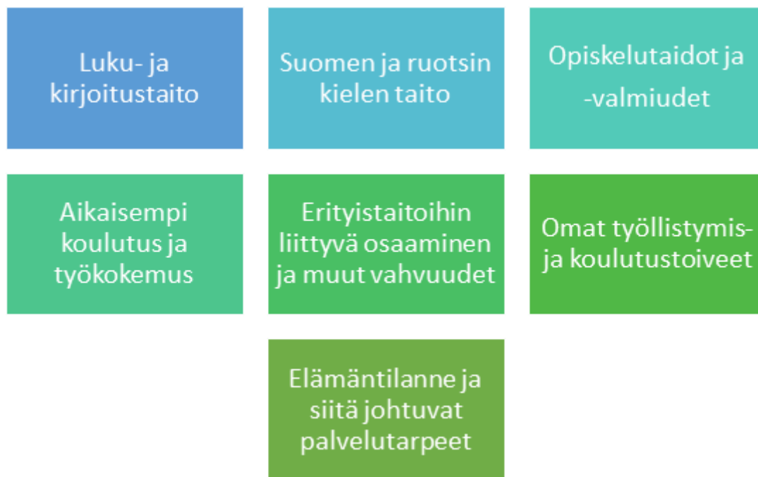
Kuvio 2. Alkukartoituksen sisältö

maahanmuuttajien koulutusta, työllisyyttä ja yrittäjyyttä sekä alueellisen segregaaion ehkäisyä. (Saukkonen 2020b, 100.)