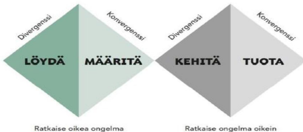
Kuvio 1 Design Councilin Tuplatimantti-prosessimalli. (Koivisto ym. 2019)

Tuota- vaiheessa rajataan ja tunnistetaan syntyneistä ideoista sellaiset, jotka ovat toimivia ja vastaavat asetettuihin tavoitteisiin. Tuota- vaiheessa testataan vaihtoehtoja asiakkailta, henkilökunnalla tai muilla sidosryhmillä. Lisäksi ratkaisuja arvioidaan teknisen toteutettavuuden ja taloudellisen kannattavuuden näkökulmasta. Lopuksi vaiheen tavoitteena on tuottaa palvelusta määritelty idea tai konsepti, jonka perusteella tehdään päätös, toteutetaanko kehitetty ratkaisu vai ei. (Koivisto ym. 2019, 46.) Kuviossa 1 on kuvattu Design Councilin Tuplatimantti-prosessimalli. (Koivisto ym. 2019)