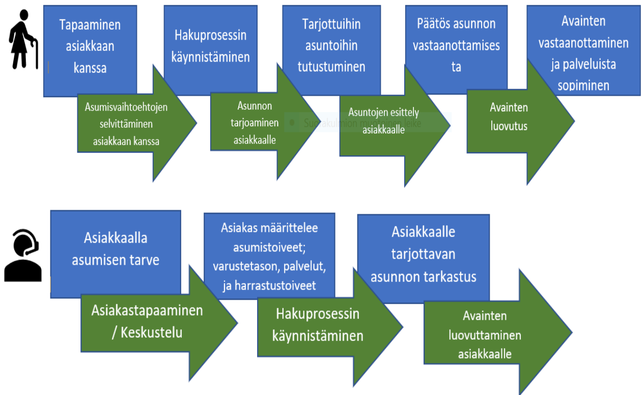
Kuvio 6. Kehittämistyön tuloksena syntynyt palvelusuunnitelma

Kuviossa 6 on visualisoitua palvelusuunnitelmaa, joka sisältää asumisen vaihtoehtoja pohtivan ikääntyneen asiakkaan tarpeiden, toiveiden, tuen tarpeen ja ratkaisun kuvaamisen. Palvelusuunnitelma sisältää myös palveluntuottajan, eli työntekijän roolin kuvaamisen. Tässä palvelusuunnitelmassa niitä ovat asiakkaan tapaaminen, hakuprosessissa avustaminen ja päätöksenteko asumisvalinnassa.