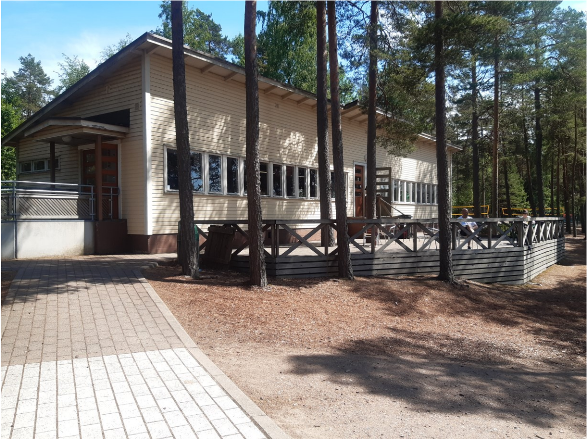
Kuva 1. Sääksin rantakahvila ja terassi rannan puolelta kuvattuna.

Sääksin uimarannalla toimii vuosittain joitakin yrittäjiä tarjoten erilaisia liikunnallisia ja vapaa-ajan palveluita. Osa yrittäjistä on lähes päivittäin koko uimakauden ajan, joidenkin taas toimesta rannalla harvemmin tai satunnaisesti. Yrittäjien tarjoamia palveluita ovat esimerkiksi Sup-lautojen vuokraus, ohjatut Zumba-tapahtumat sekä Bungee-trampoliini. Kesäkaudella uimarannalla ja sen lähiympäristössä järjestetään useita urheilutapahtumia, vakiintuneita ovat Triathlon-, suunnistus- ja maastopyöräilykilpailut. Kesällä 2020 alueella järjestettiin veteraanien polkupyöräsuunnistuksen maailmanmestaruuskilpailut.