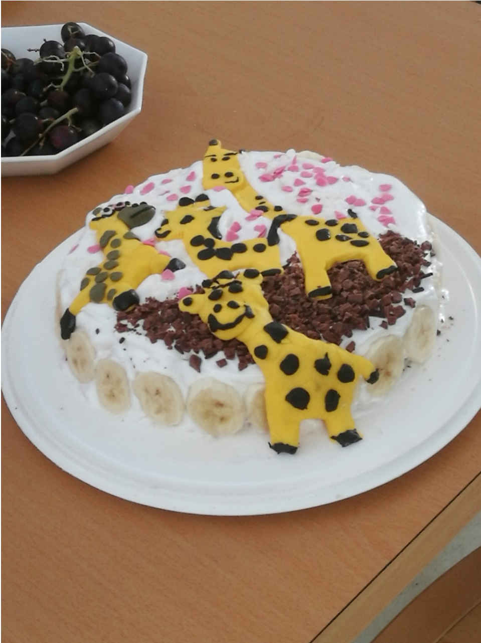
Kuva 2. Sääksin nuorten itse suunnittelema ja tekemä kirahvi kakku