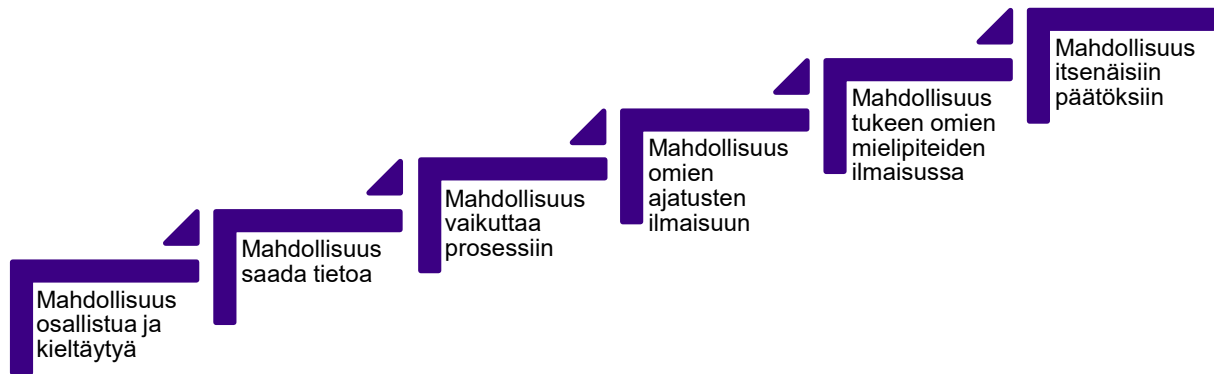
Kuvio 1. Osallisuuden portaat.

Lapsella tulee aina olla mahdollisuus osallistua tai olla osallistumatta. Lastensuojelussa voi tulla eteen tilanteita, joihin aikuisenkin voi olla haastavaa osallistua. Jos lapsen ei ole mahdollista tai mielekästä osallistua, tulee osallisuus turvata jotenkin toisin. Osallisuutta voi olla myös kieltäytyminen ja siihen tulee antaa mahdollisuus. (Lapsen osallisuus, 2019.)