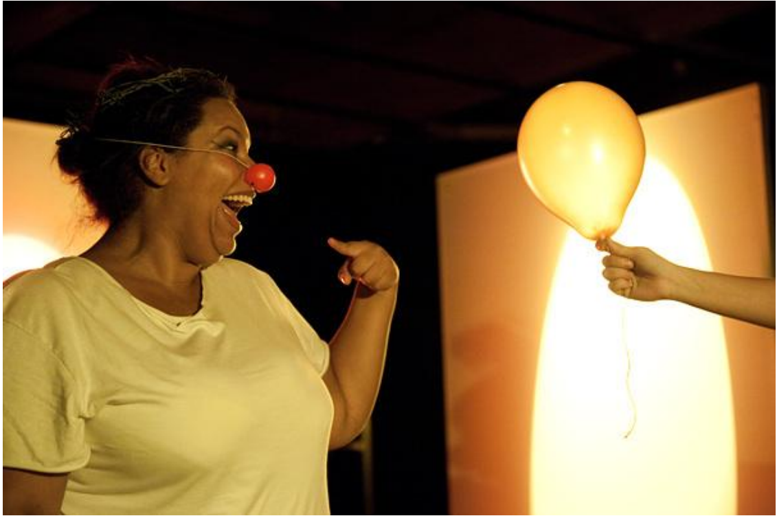
Kuva 3. Dialogisuuden ydin koostuu toisen tunteiden ja tarpeiden kuulemisesta ja hyväksymisestä. (Viimeinen hymy peilissä. Klovneria- kohtaus).