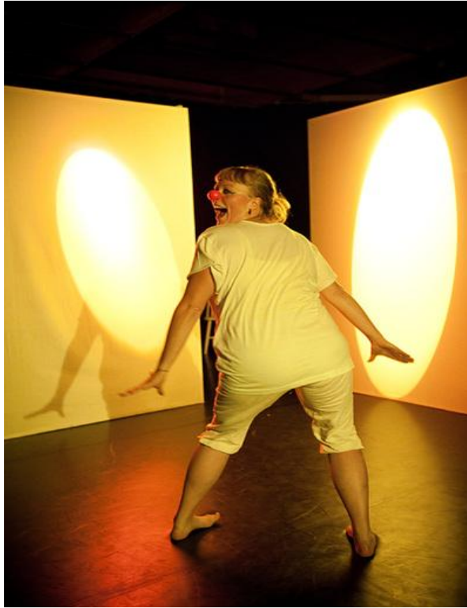
Kuva 2. Klovneria- kohtauksessa saimme pitää hauskaa myös yleisön kanssa. (Viimeinen hymy peilissä)

Yleensä oletetaan, että kun näytelmä tulee ensi-iltaan, teos on valmis, ohjaajantyö on tehty ja vastuu siirtyy näyttelijälle harjoittamaan teatteriinkin kuuluvaa toiston taidetta. Mielestäni oli todella mielenkiintoista, joskin pelottavaakin, rikkoa tätä sääntöä Viimeisessä hymyssä . Tämä oli tietenkin seurausta lyhyestä, joskin intensiivisestä harjoituskaudesta. Meillä ei yksinkertaisesti jäänyt aikaa harjoitella valmista esitystä kovinkaan paljon, muiden tuotannollisten asioiden syödessä vuorokaudestamme tunteja. Niinpä kohtaukset hioutuivatkin valmiiksi vasta esitysvaiheessa - jos silloinkaan. Epävarmuutta oli silti helpompi kestää, sillä lupa ohjata itse itseään antoi erilaista vapautta hengittää ja luoda vielä esityksessään, jossa yksi kohtaus pohjautuikin enemmän tai vähemmän improvisaatioon. Vapauden vastapainona eli koko ajan myös suuri vastuu omasta tekemisestä.