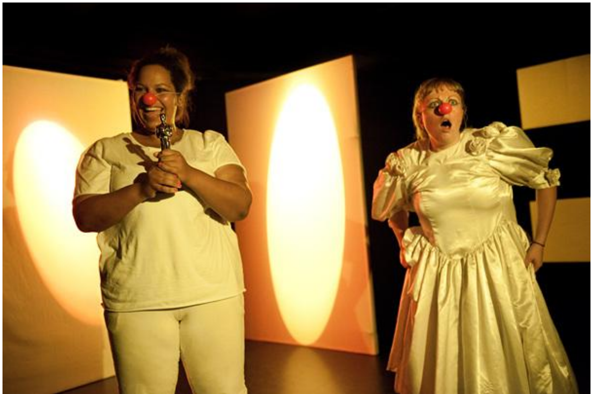
Kuva 5. Lopussa kiitos seisoo. Vaikka ryhmäprosessimme kohtasi omat haasteensa, onnistuimme ratkaisemaan nämä ongelmat ja kehittämään ryhmänä. (Viimeinen hymy peilissä. Klovneria-kohtaus)

osallistavan teatterin välillä. Mielestäni kaikki esittävä teatteri on aina osallistavaa, jos se haastaa yleisönsä pohtimaan esityksensä aiheita ja teemoja, ja osallistavassa teatterissa, tehtynä sitten ammattilaisryhmällä tai ei, on aina taiteellista arvoa ja kulttuurillista merkitystä. Prosessimme kannalta onnekasta oli, että saimme toteuttaa esityksemme näin vapaisista lähtökohdista käsin, ilman huolta taloudellisesta menestyksestä tai yleisötavoitteista. Itselleni tämä prosessi ja esitys oli tärkeä ja antoisa kokemus, ja yleisöpalautteen perusteella esityksemme antoi taiteellisesti merkityksellisen kokemuksen myös katsojille. Viimeinen hymy peilissä oli produktiona erityisesti opettava ja kehittävä kokemus tekijöille itselleen sekä oppitunti ryhmädynamiikkaan vaikuttaviin prosesseihin.