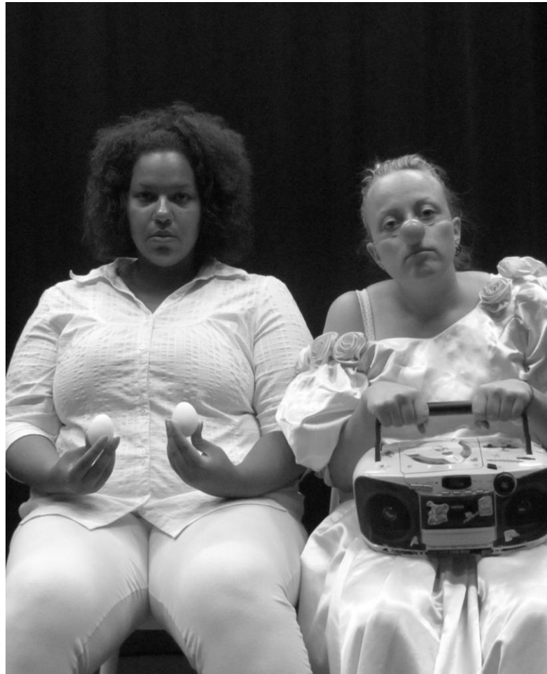
Kuva 1. Huumori yhdistää. Minä ja työparini yhteispotretissa. (Viimeinen hymy peilissä 2011)