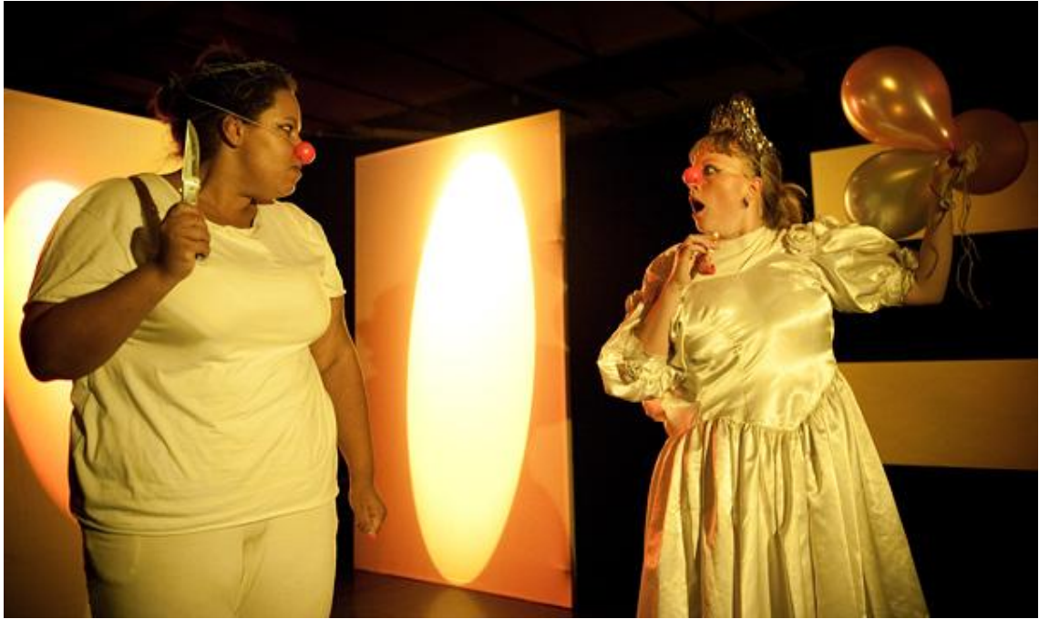
Kuva 4. Klovneriassa ja ryhmätyössä on paljon yhteistä. Samoin kuin ryhmä muodostuu ja toimii yksilöidenä kautta, myös klovneria perustuu esiintyjän oman persoonallisuuteen, elämäkokemukseen ja tunteisiin. Klovneria on myös vuorovaikutusta parhaimmillaan. (Viimeinen hymy peilissä. Klovneria- kohtaus)