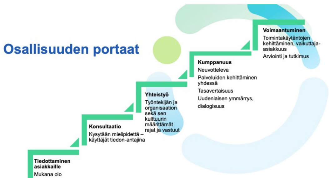
Kuvio 1. Osallisuuden portaat (kuvio: Terveyden ja hyvinvointilaitos)

avulla voidaan peilata osallisuuden toteutumista nuorisotilalla. Osallisuuden portaisiin kuuluu viisi vaihetta (Kuvio 1). Ensimmäinen on yksisuuntainen prosessi, jossa nuorilta tiedustellaan omaa mielipidettä ja toiveita, tilanteen muutoksille. Toisessa vaiheessa aikuiset ja nuoret olivat vuoropuhelussa, jossa käytiin läpi toiveita ja mielipiteitä. Keskustelua ohjasivat aikuiset. Kolmatta vaihetta kutsutaan luovaksi yhteistyöprosessiksi. Prosessinomaisella kehitysoitteella aikuiset ja nuoret yhdessä, kehittäviä ja uusia asioita, luovia menetelmiä käyttäen. Aikuiset kunnioittavat nuorten näkemyksiä ja hakivat aktiivisesti uusia tapoja, nuorten mielipiteet huomioon ottaen. Neljännessä vaiheessa lähdettiin kohti itsenäistä päätöksentekoa. Aikuiset tukivat nuorten itsenäistä toimintatapaa ja olivat avuksi tarvittaessa. Viimeisessä eli viidennessä vaiheessa oli saavutettu itseohjautuvuus, jossa aikuiset toimivat toiminnan mahdollistajina. Osallisuuden mittari oli se, kuinka hyvin nuori kokee osallisuuden onnistuneet, projektin kaikissa vaiheissa ja miten hyvin osallisen positio säilyi projektin aikana (Nousiainen & Training 2017).