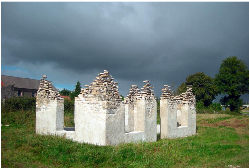
Kuva 4. Cornelia Konrads, Settlement, 2010 (Konrads 2010)