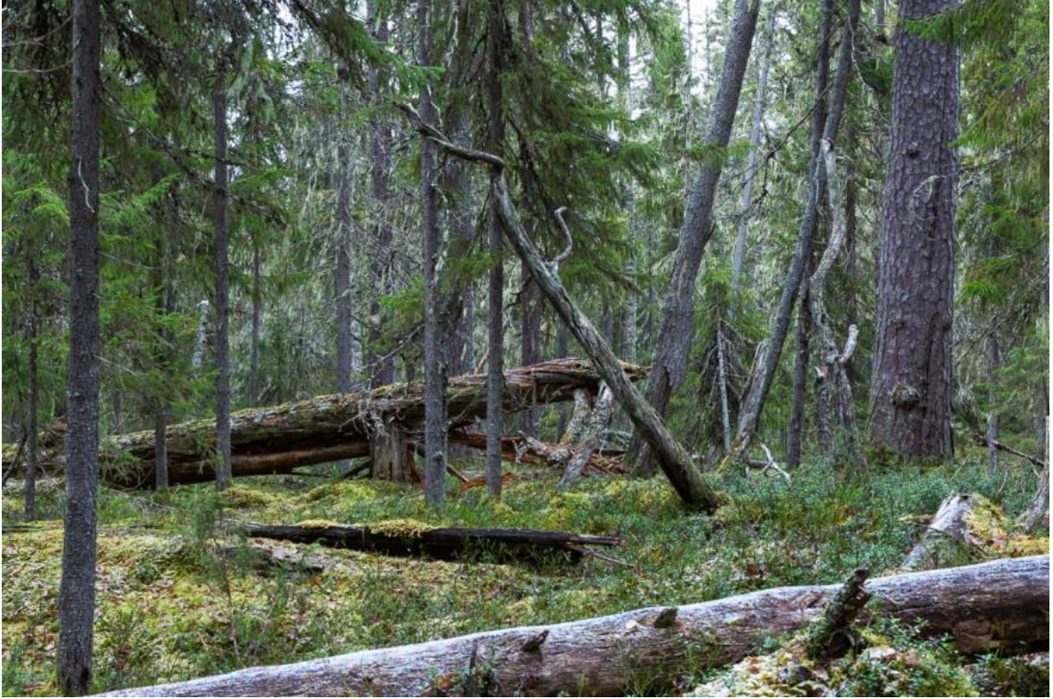
Kuva 9. Luonnontilainen metsä (Koiviso & Sauso 2019)