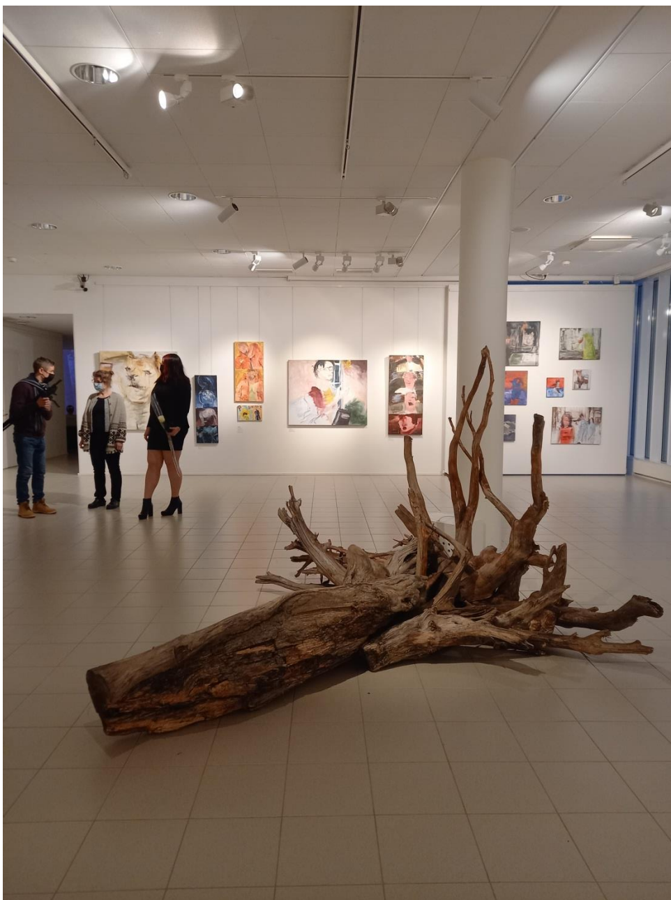
Kuva 13. Teos Joutomaa Imatran taidemuseolla