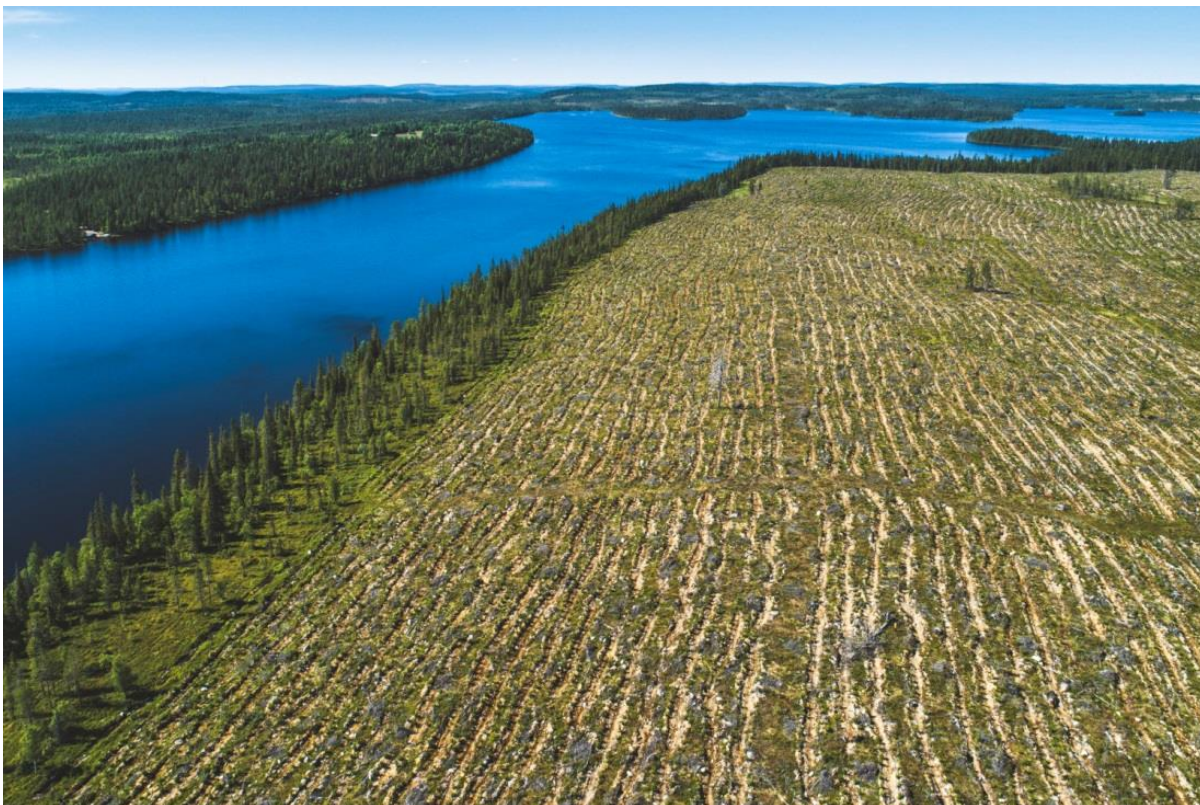
Kuva 8. Kuusamon Isoniemessä 110 hehtaarin avohakkuu (Jokiranta)

Metsähakkuita ei tulla lopettamaan, eikä se ole vaatimukseni tässä opinnäytetyössä. Metsän hoito ja sen menetelmät ovat osa suomalaista metsäperinnettä ja sen jatkuvuus on osa suurempaa kokonaisuutta, Suomen kansan identiteettiä. En kuitenkaan usko, että kuvan 8 maisema on yhdellekään ihmiselle mieliksi. Luonnontilaista metsää (kuva 9) on Suomessa jäljellä enää muutama yhtenäinen alue.