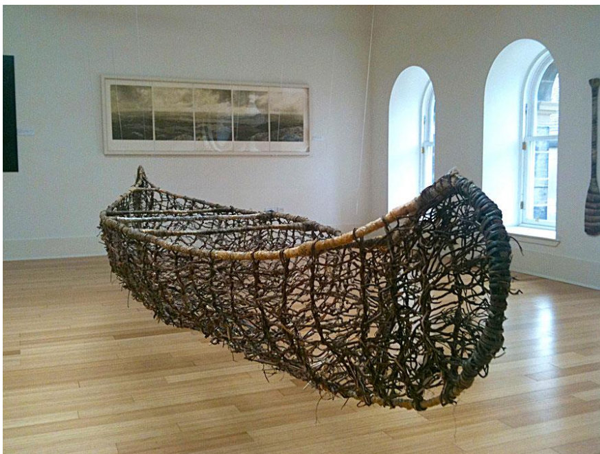
Kuva 7. Chris Drury, Land Water Vessel and Land and Water, 2011 (Drury 2011)