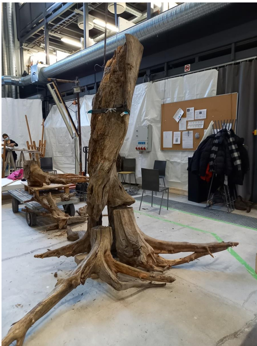
Kuva 12. Veistoksen ensimmäisiä kokeiluja

Taiteellisen työskentelyni ohjaaja oli tapaamassa minua opinnäytteeni produktion osalta kuvan työvaiheen aikana. Keskustelimme ohjaajani kanssa siitä, mitä teos kuvaa ja millaista tunnelmaa se välittää katsojalle. Ohjaava taiteilija oli tietoinen metsähakkuuaspektista teoksessani.