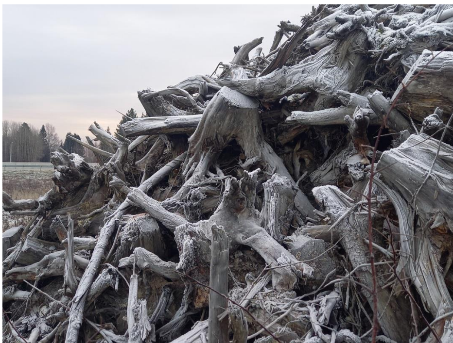
Kuva 1. Kantokasa Lappeenrannan Mustolassa

Suomalaisia on usein kuvattu metsäkansaksi, katajaiseksi kansaksi. Kataja kuvasi suomalaista sisukkuutta, jota pieni maa kahden kilpailevan valtion välissä tarvitsikin. Kataja saattoi taipua ja vääntyä, muttei koskaan katkennut. Metsä ja puut näissä suomalaisuuden vertauskuvissa kuvasivat kansan urheutta ja syvää voimaa. (Sarajas-Korte 1987, 9.)