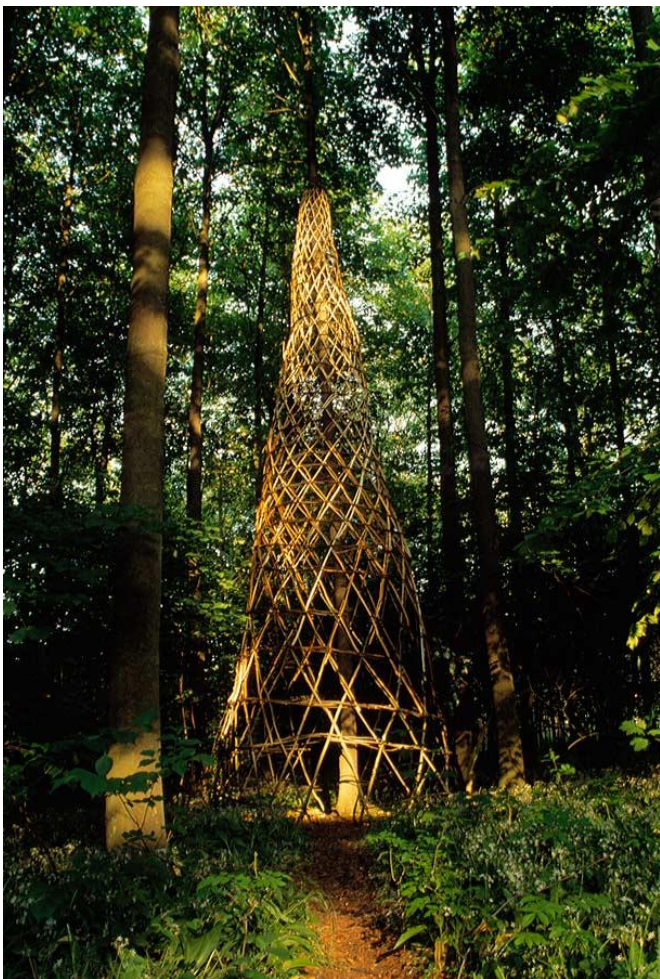
Kuva 6. Chris Drury, Tree Vortex, 1996 (Drury 1996)