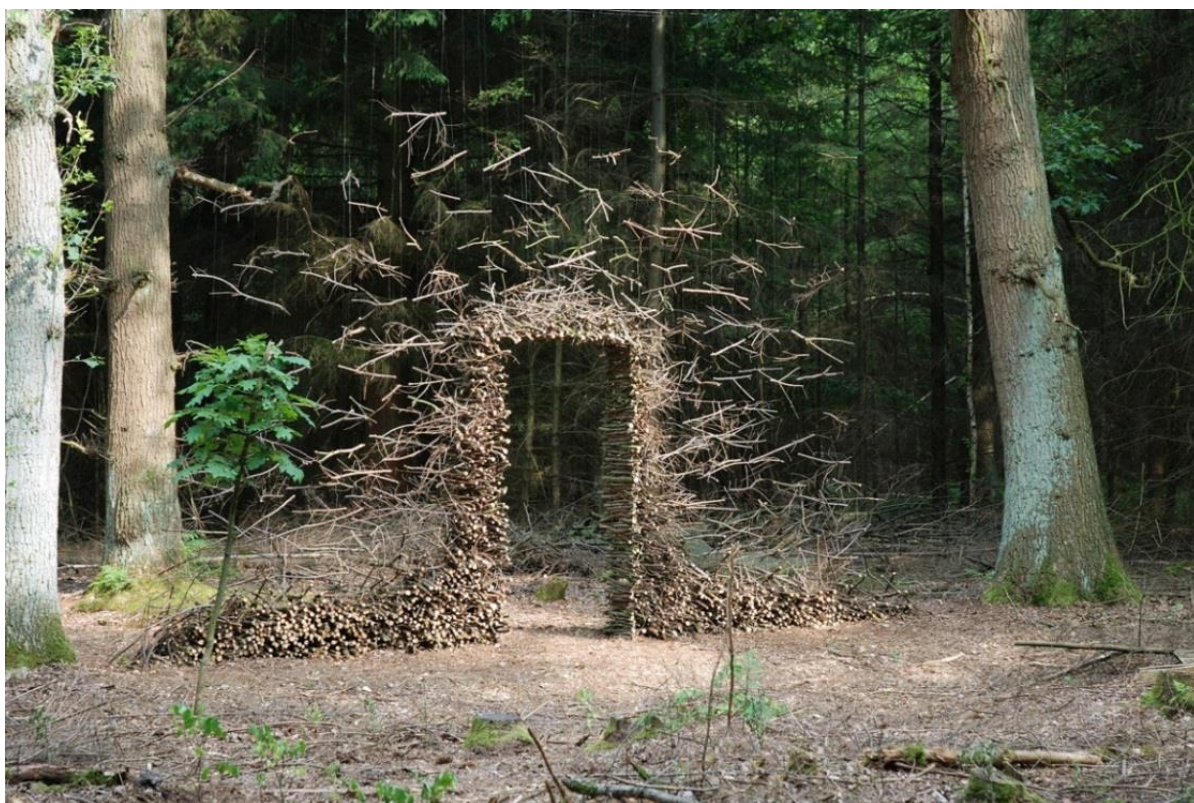
Kuva 3. Cornelia Konrads, Passage, 2007( Konrads 2007)

Cornelia Konrads on ympäristötaiteilija ja tilannetaiteilija. Hän käyttää usein omasta lähiympäristöstä löytyviä asioita ja yhdistää niitä harmonisella tavalla. Konrads usein toimii impulsiivisesti taideteoksen luomisvaiheessa ja käyttää tilanteessa olevia asioita ja tavaroita taiteessaan, tästä tulee nimitys tilannetaiteilija. Usein hänen taiteessaan näkee raakoja luonnonmateriaaleja, joita hän on kasannut eräänlaisiksi installaatioiksi ja tilanteiksi (kuva 3). Konrads valmistaa usein tietyille paikoille ns. mittatilaustöitä tai paremmalla termillä site-specific-teoksia, jotka ovat vain tietylle paikalle luotuja paikan vaikutuksesta (kuva 4). ( Art Docent Program 2019.)